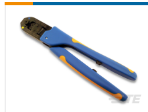
TE 产品编号 91505-1 CCII TYPE III+ 24-16 ASSY