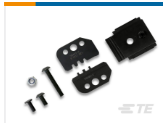
TE 产品编号 58495-2 PROCRIMPER DIE ASSY MULTIMATE