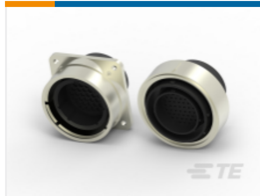
TE 产品编号 CAT-AM71-C83998C Circular Plastic Connector, CMC Series 1