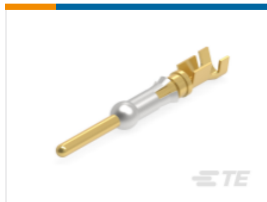
TE 产品编号 66182-1 III+ PIN, SOLDER, 30AU, 10AU FLASH, LP