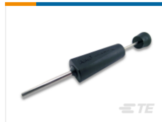
TE 产品编号 305183 EXTRACT TOOL TYPE 2 20-16