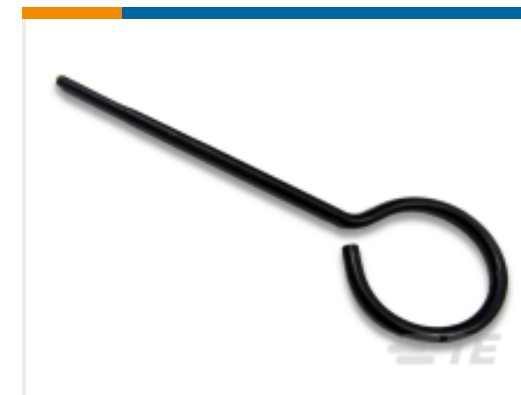
TE 产品编号 200893-2 INSERTION TOOL CONT