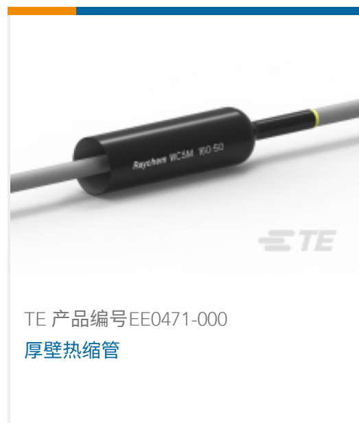
TE 产品编号EE0471-000 厚壁热缩管