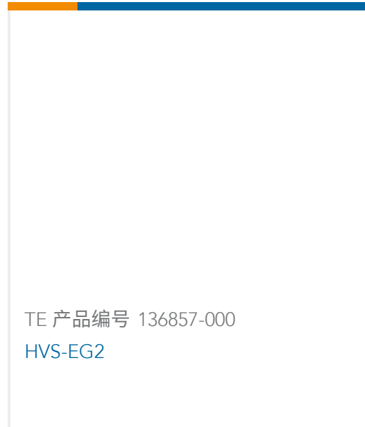
TE 产品编号 136857-000 HVS-EG2