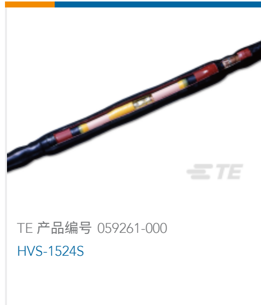
TE 产品编号 059261-000 HVS-1524S