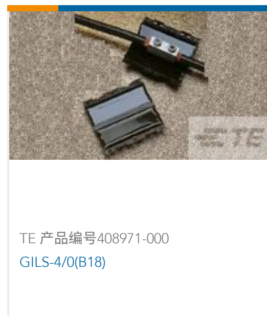
TE 产品编号408971-000 GILS-4/0(B18)