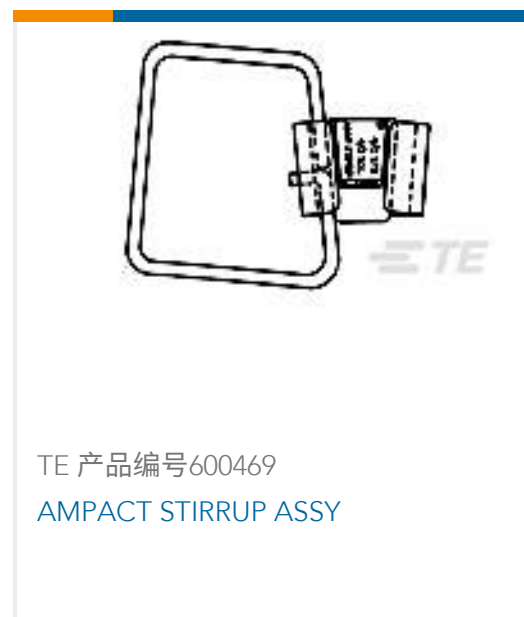
TE 产品编号600469 AMPACT STIRRUP ASSY