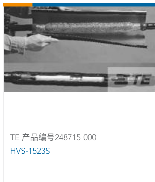
TE 产品编号248715-000 HVS-1523S