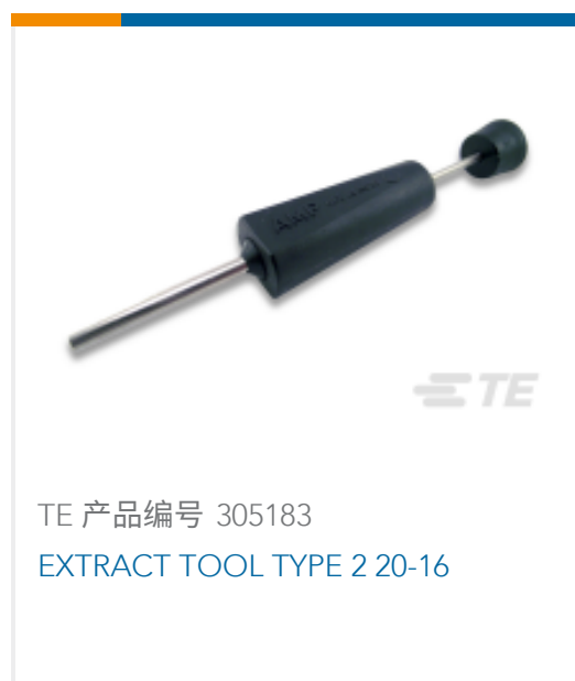
TE 产品编号 305183 EXTRACT TOOL TYPE 2 20-16