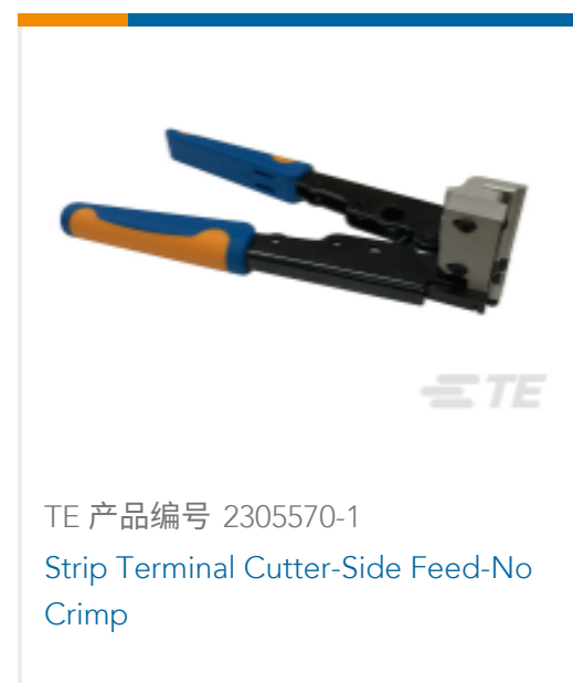
TE 产品编号 2305570-1 Strip Terminal Cutter-Side Feed-No Crimp