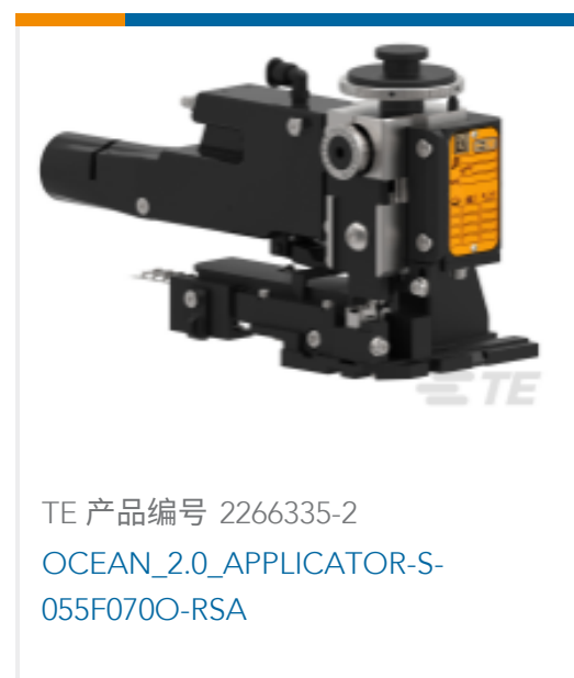
TE 产品编号 2266335-2 OCEAN_2.0_APPLICATOR-S-055F0700-RSA