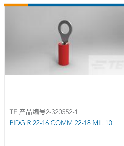
TE 产品编号2-320552-1 PIDG R 22-16 COMM 22-18 MIL 10