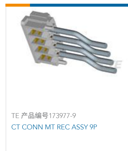
TE 产品编号173977-9 CT CONN MT REC ASSY 9P