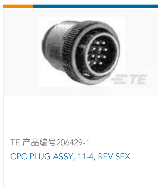
TE 产品编号206429-1 CPC PLUG ASSY, 11-4, REV SEX