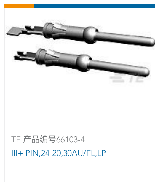
TE 产品编号66103-4 III+ PIN,24-20,30AU/FL,LP