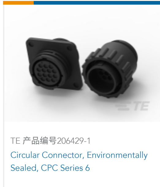
TE 产品编号206429-1 Circular Connector, Environmentally Sealed, CPC Series 6