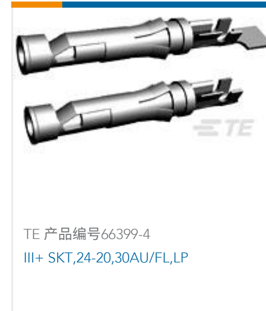
TE 产品编号66399-4 III+ SKT,24-20,30AU/FL,LP