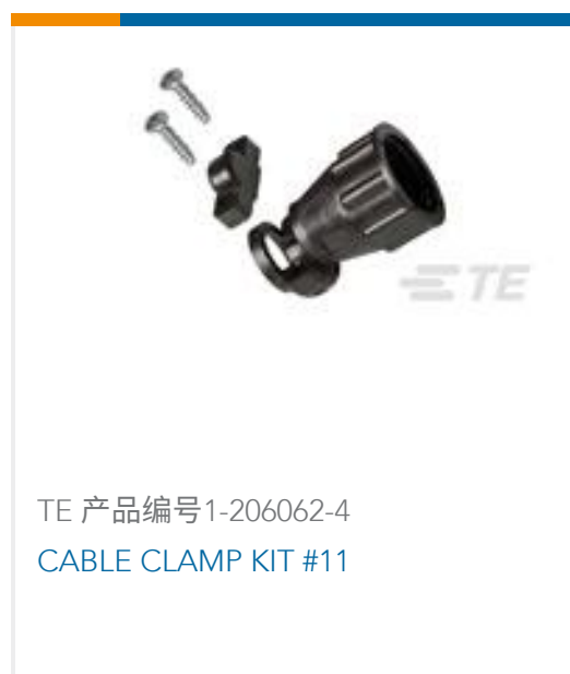
TE 产品编号1-206062-4 CABLE CLAMP KIT #11