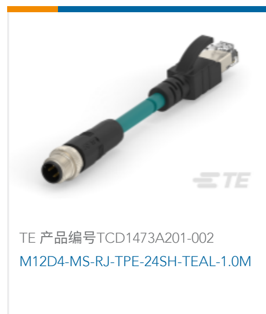
TE 产品编号TCD1473A201-002 M12D4-MS-RJ-TPE-24SH-TEAL-1.0M