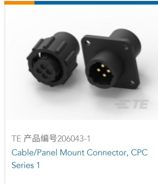
TE 产品编号206043-1 Cable/Panel Mount Connector, CPC Series 1