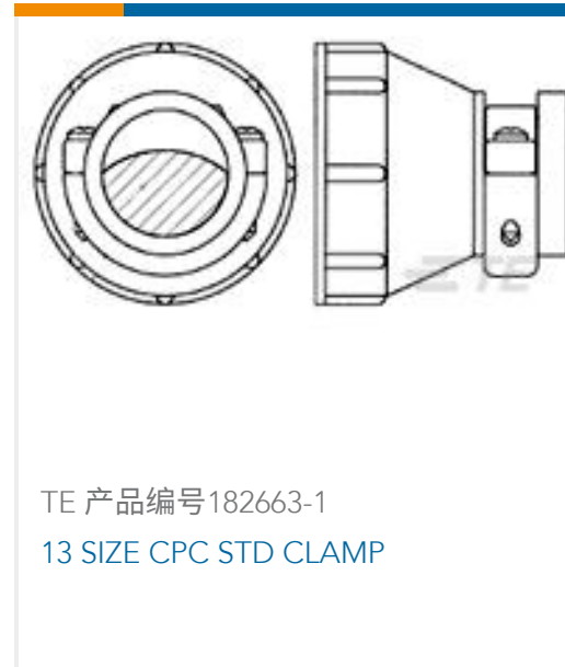
TE 产品编号182663-1 13 SIZE CPC STD CLAMP