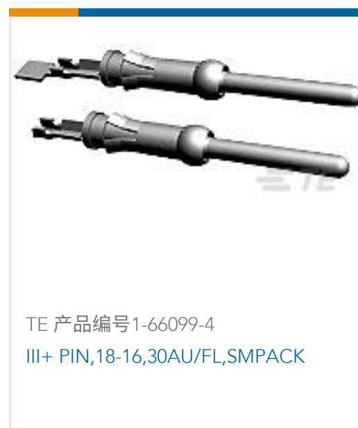
TE 产品编号1-66099-4 III+ PIN,18-16,30AU/FL,SMPACK