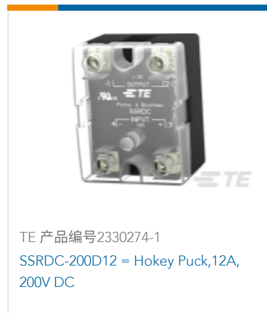
TE 产品编号2330274-1 SSRDC-200D12 = Hokey Puck, 12A, 200V DC