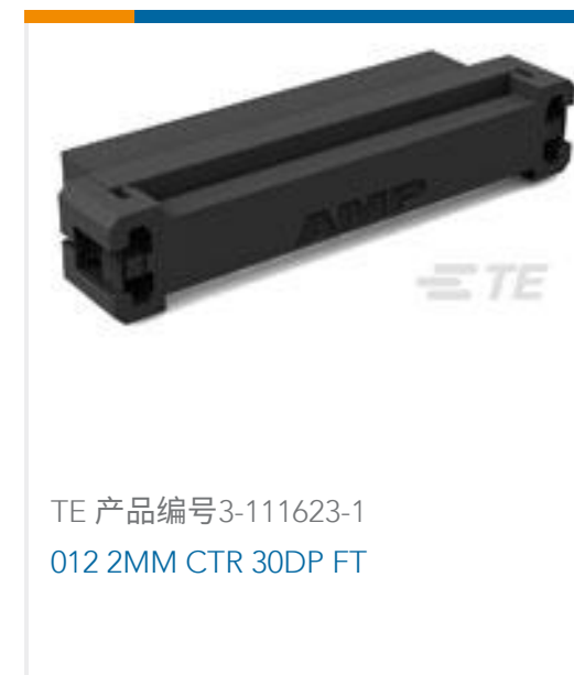
TE 产品编号3-111623-1 012 2MM CTR 30DP FT