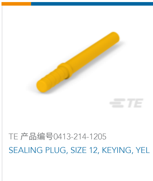
TE 产品编号0413-214-1205 SEALING PLUG, SIZE 12, KEYING, YEL