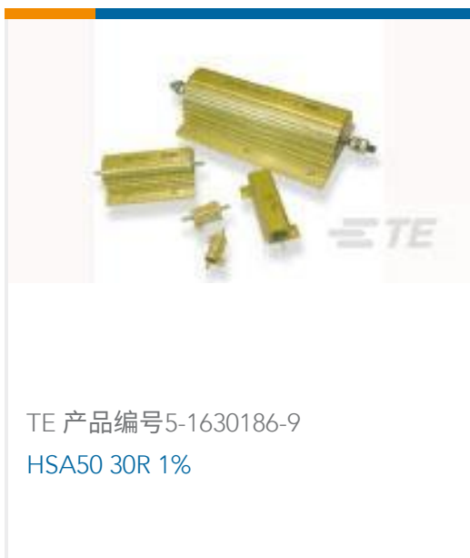
TE 产品编号5-1630186-9 HSA50 30R 1%