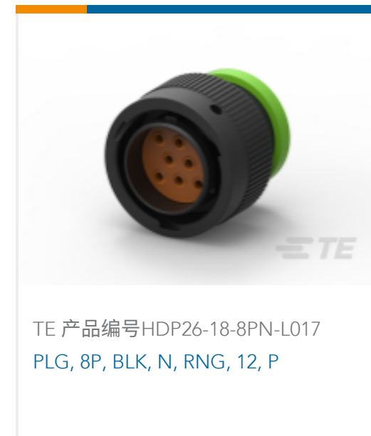
TE 产品编号HDP26-18-8PN-L017 PLG, 8P, BLK, N, RNG, 12, P