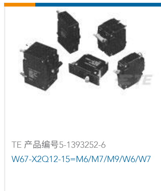
TE 产品编号5-1393252-6 W67-X2Q12-15=M6/M7/M9/W6/W7