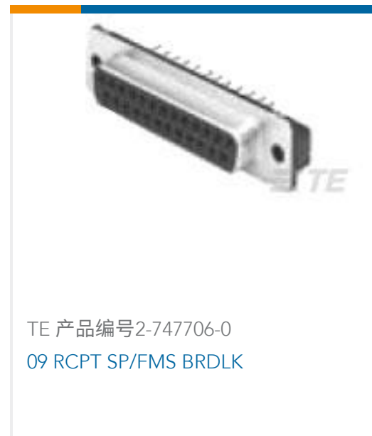
TE 产品编号2-747706-0 09 RCPT SP/FMS BRDLK