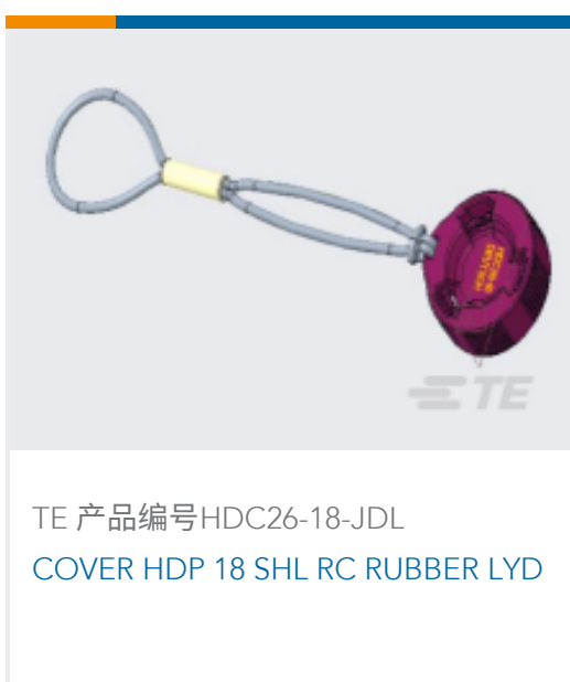
TE 产品编号HDC26-18-JDL COVER HDP 18 SHL RC RUBBER LYD