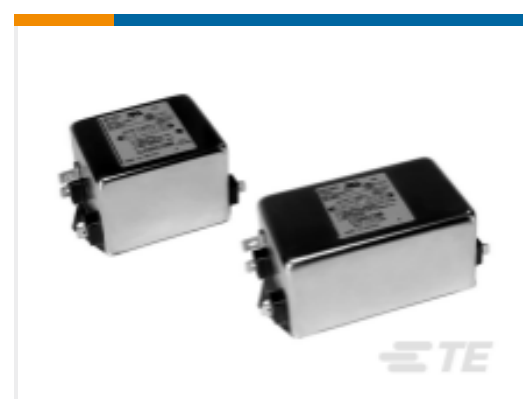
TE 产品编号 CAT-C8114-N1 Single Phase Filters, Corcom N Series