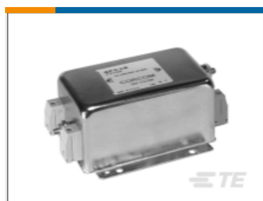
TE 产品编号 CAT-C8114-F299B Single Phase Filters, Corcom FC Series