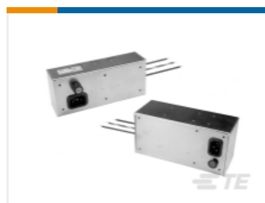
TE 产品编号 CAT-C8114-AQ1 Single Phase Filters, Corcom AQ Series