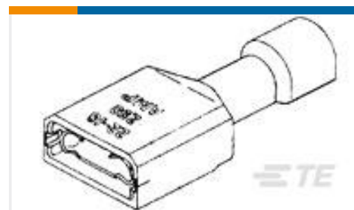
TE 产品编号7-520366-2 ULTRAFast 110 ASSY REC 26-22 TPBR LP