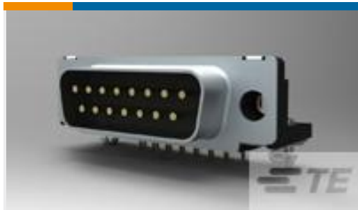
TE 产品编号5747841-3 15 MSFL PLUG RA 318 (IN,FM,BL)