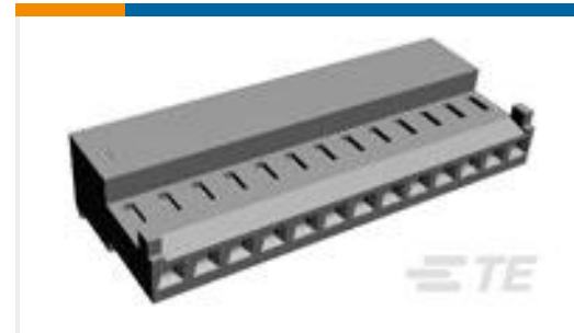
TE 产品编号4-644083-3 13P MTA100 CONN ASSY POL TAB