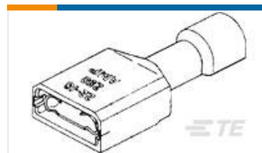
TE 产品编号2-520411-2 ULTRA-FAST 187 ASY REC 22-18 TPBR