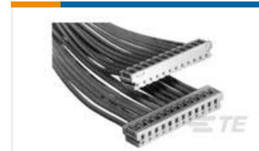
TE 产品编号6-179228-2 CT CRIMP-2 REC HSG 2P BLACK