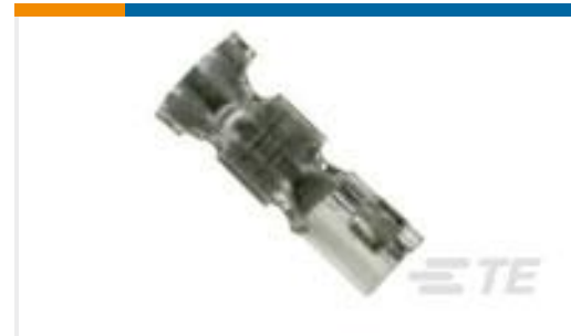
TE 产品编号179227-4 AMP CT CRIMP-2 REC CONT AU