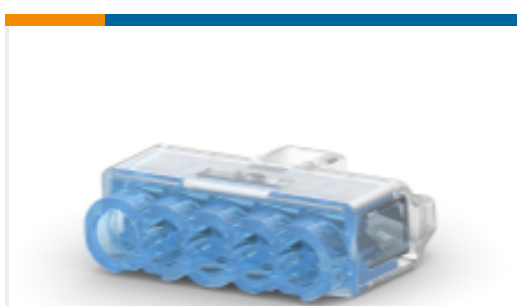
TE 产品编号2324697-5 PUSH GRIP CONNECTOR 5P