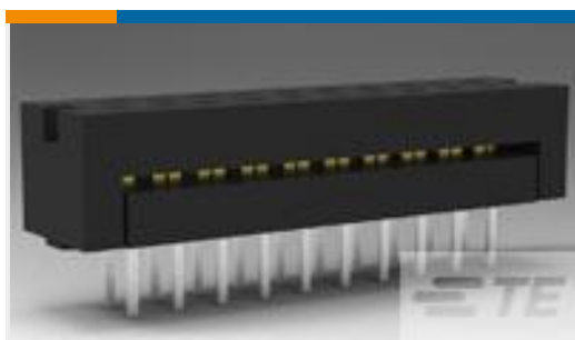
TE 产品编号1-746610-5 20 DIP PLUG, 100CL, LEAD FREE