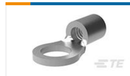
TE 产品编号2-35476-1 TERMINAL,SOLIS R 12-10 6