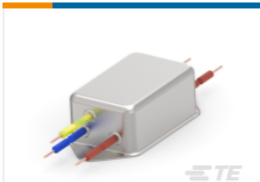
TE 产品编号3-1609028-0 3FBH3=F8590