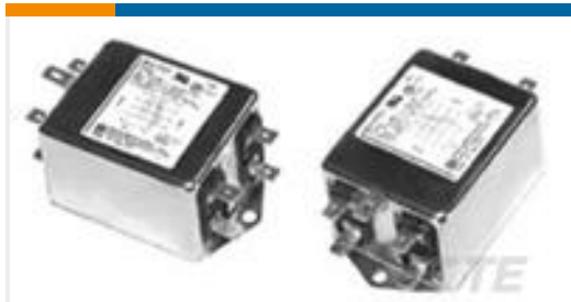
TE 产品编号6609066-2 6AYO1=F7692 S0