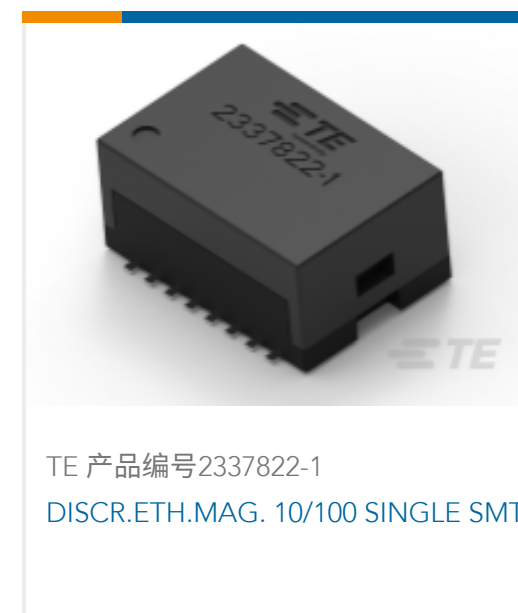
TE 产品编号2337822-1 DISCR.ETH.MAG. 10/100 SINGLE SMT