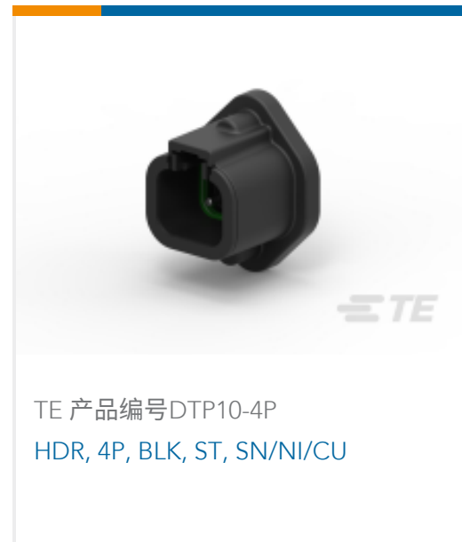
TE 产品编号DTP10-4P HDR, 4P, BLK, ST, SN/NI/CU