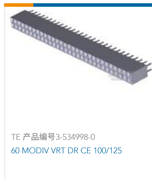
TE 产品编号3-534998-0 60 MODIV VRT DR CE 100/125