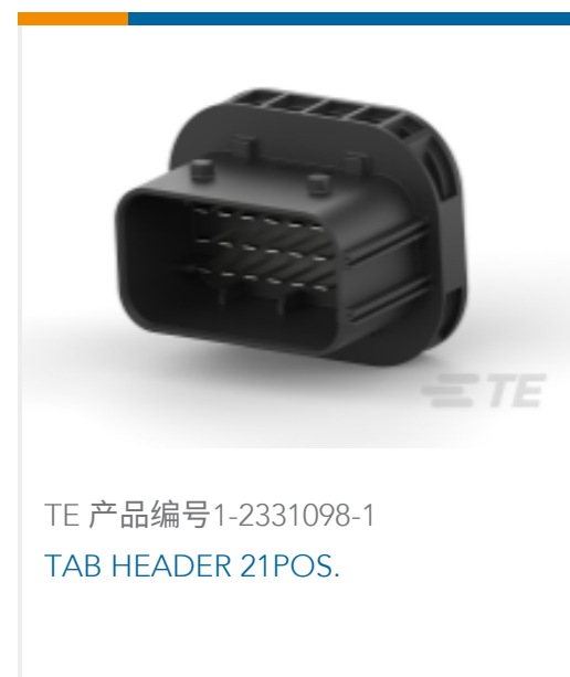
TE 产品编号1-2331098-1 TAB HEADER 21POS.