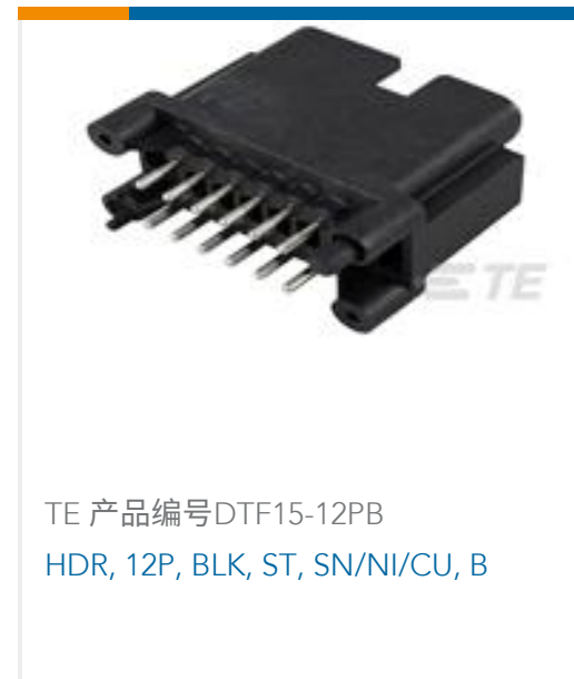
TE 产品编号DTF15-12PB HDR, 12P, BLK, ST, SN/NI/CU, B