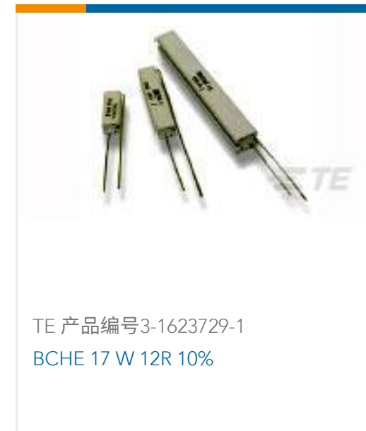
TE 产品编号3-1623729-1 BCHE 17 W 12R 10%