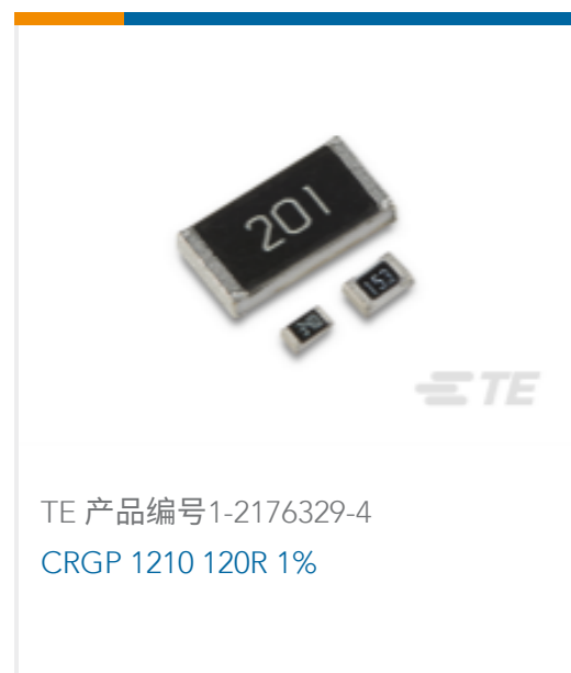
TE 产品编号1-2176329-4 CRGP 1210 120R 1%