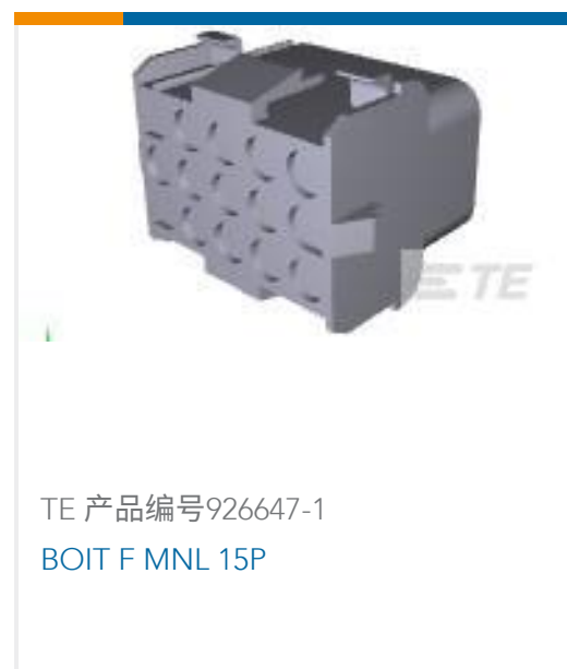
TE 产品编号926647-1 BOIT F MNL 15P