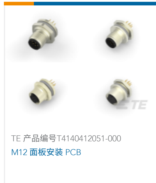
TE 产品编号T4140412051-000 M12 面板安装 PCB