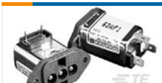
TE 产品编号6609075-7 10DAFP=F7983 S0