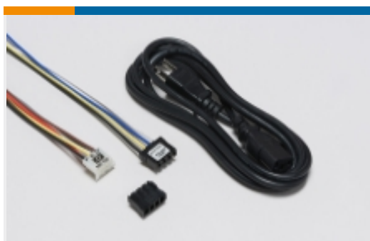
EMI 和 EMC 附件(4)