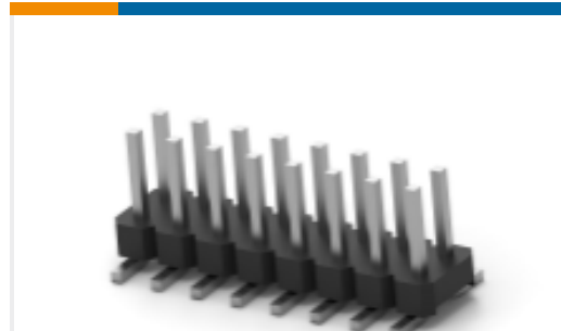
TE 产品编号2842142-7 14P,2MM,BRK HDR,DRVT,SMD,0.1AU, TR W/CAP