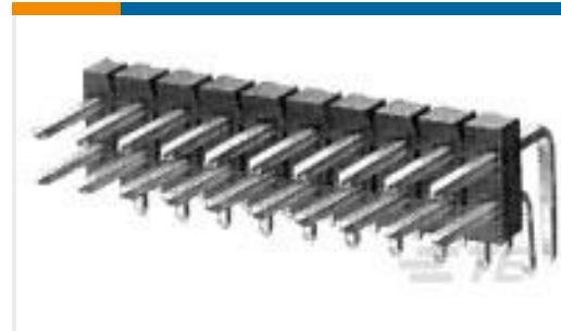
TE 产品编号5-103330-2 04 MODII HDR DRRR B/A .100 CL LF