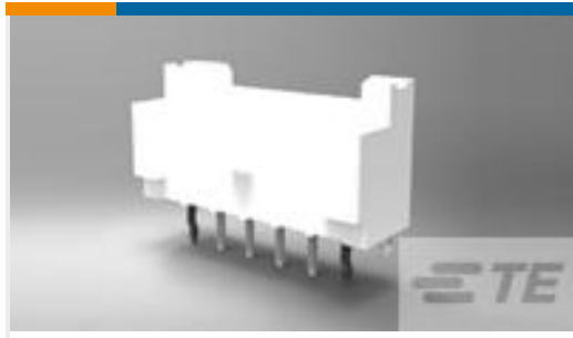
TE 产品编号1-1744418-6 16 POS EP 2.5 HDR, GLOW WIRE