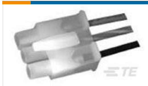
TE 产品编号1609136-2 GA310 DA PLUG ASSY=F6824