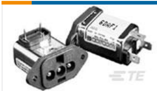
TE 产品编号6609075-7 10DAFP=F7983 S0