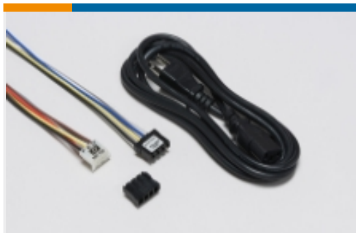
EMI 和 EMC 附件(4)