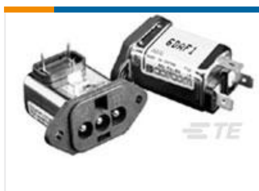
TE 产品编号6609075-7 10DAFP=F7983 S0