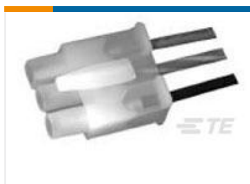
TE 产品编号1609136-2 GA310 DA PLUG ASSY=F6824