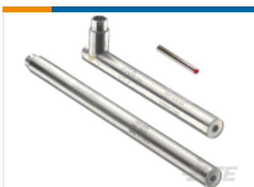
TE 产品编号02560413-000 LVDT HCA 050 ASSY