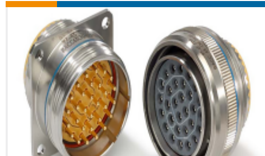
TE 产品编号ZPF000000000008615 983-6S 14-15 SN-L