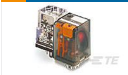
TE 产品编号8-1393091-5 MT323048