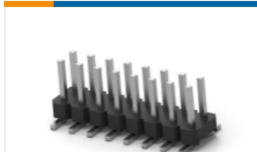
TE 产品编号2842142-7 14P,2MM,BRK HDR,DRV,T,SMD,0.1AU, TR W/CAP