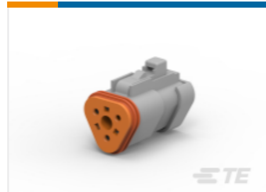
TE 产品编号DT06-3S-C017 PLG, 3P, GRY, BLOCKED