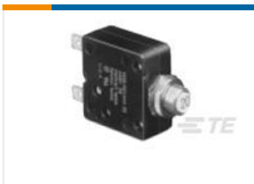
TE 产品编号1-1393249-3 W58-XB1A4A-25=W58