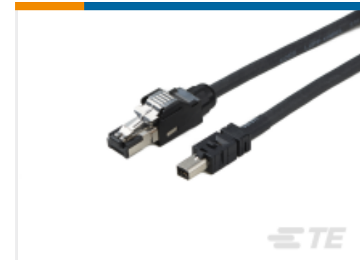
TE 产品编号2-2205133-3 CA MINI IO TYPE I IND RJ45