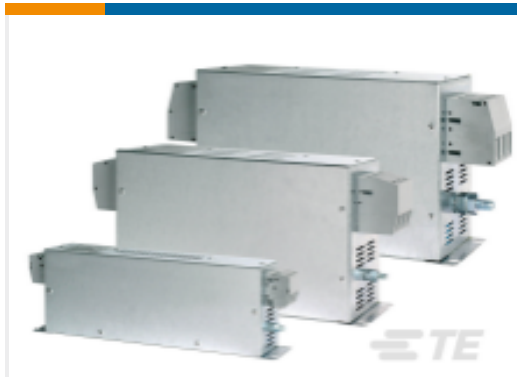
TE 产品编号1609989-5 3 Phase Filters, Corcom BCF Series