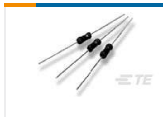
TE 产品编号4-1625885-9 1W SM M/OX 5% 270K