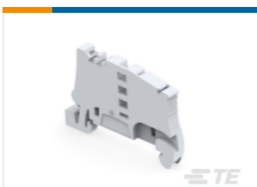
TE 产品编号1SNK900002R0000 BAZ1