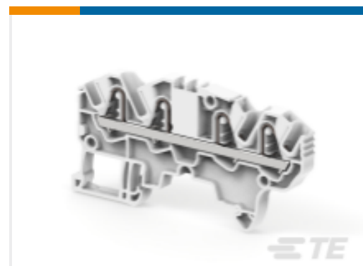
TE 产品编号1SNK705012R0000 ZK2.5-4P