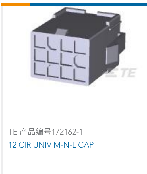
TE 产品编号172162-1 12 CIR UNIV M-N-L CAP