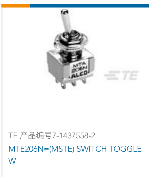
TE 产品编号7-1437558-2 MTE206N=(MSTE) SWITCH TOGGLE W