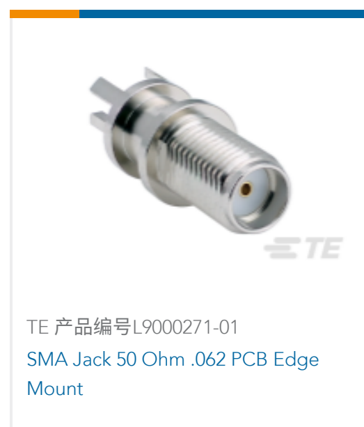
TE 产品编号L9000271-01 SMA Jack 50 Ohm .062 PCB Edge Mount