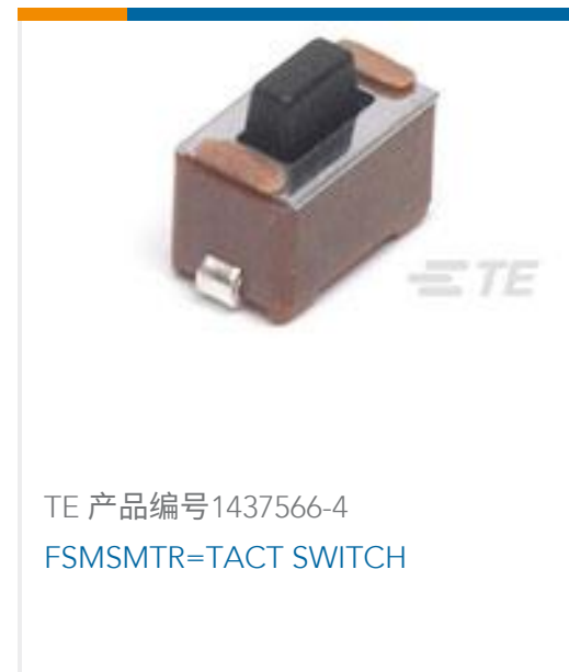
TE 产品编号1437566-4 FSMSMTR=TACT SWITCH