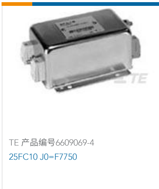
TE 产品编号6609069-4 25FC10 J0=F7750