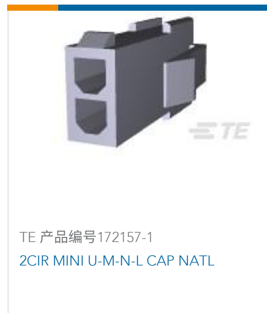
TE 产品编号172157-1 2CIR MINI U-M-N-L CAP NATL