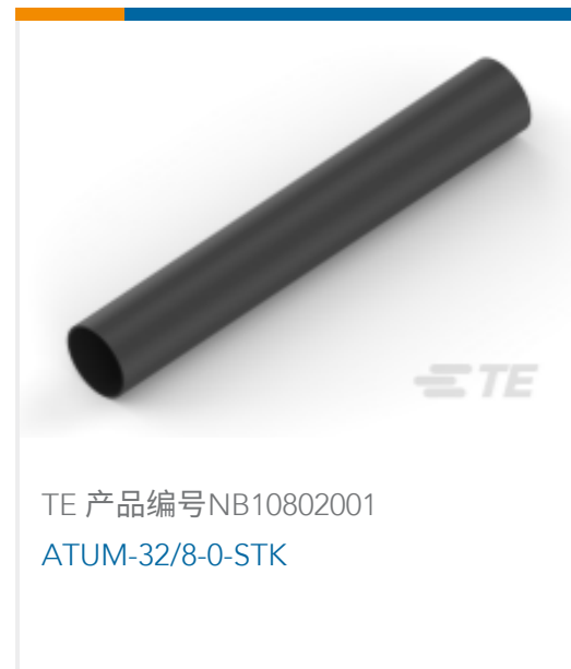
TE 产品编号NB10802001 ATUM-32/8-0-STK