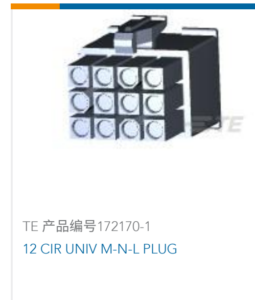
TE 产品编号172170-1 12 CIR UNIV M-N-L PLUG