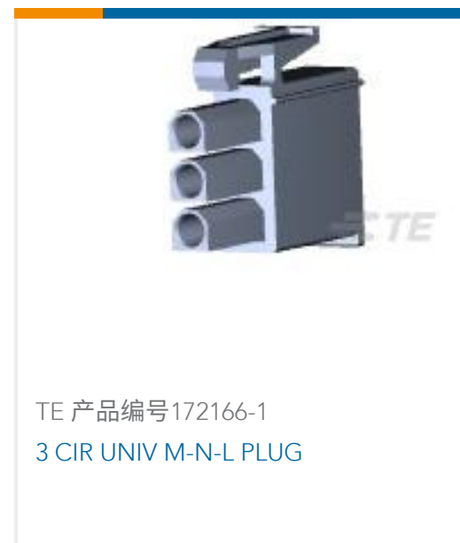
TE 产品编号172166-1 3 CIR UNIV M-N-L PLUG