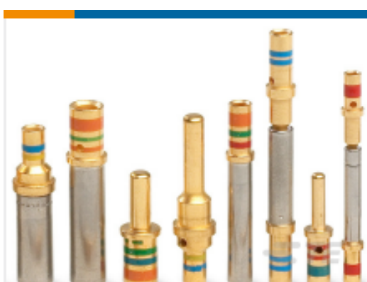
TE 产品编号ZPF00000000000373 006-0972-20 SCC