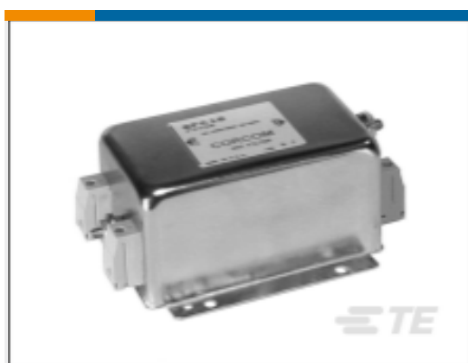
TE 产品编号 CAT-C8114-F299B Single Phase Filters, Corcom FC Series