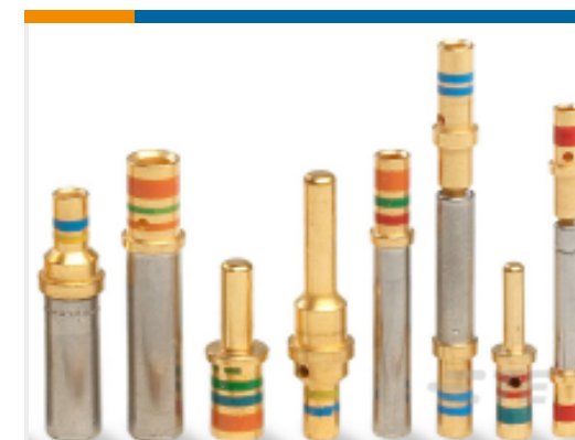
TE 产品编号ZPF00000000000361 006-0937-16 SCC