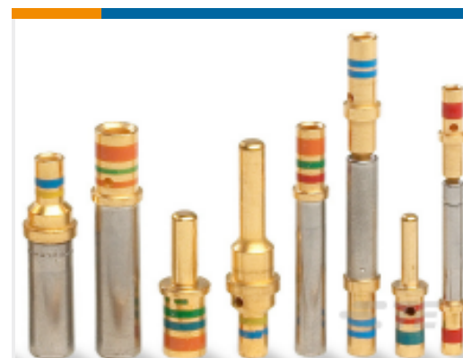
TE 产品编号ZPF00000000000338 006-0912-16 SCC