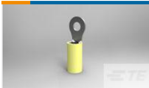
TE 产品编号2-35108-1 TERMINAL,PIDG R 12-10 8