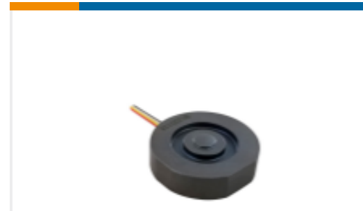
TE 产品编号20009605-05 FX292X-100A-0025-L