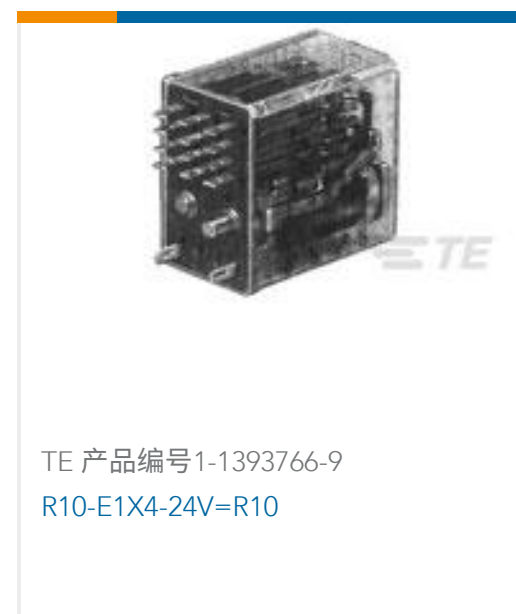
TE 产品编号1-1393766-9 R10-E1X4-24V=R10