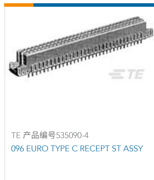
TE 产品编号535090-4 096 EURO TYPE C RECEPT ST ASSY