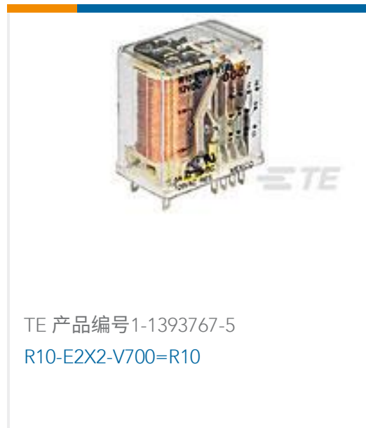
TE 产品编号1-1393767-5 R10-E2X2-V700=R10