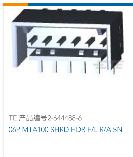
TE 产品编号2-644488-6 06P MTA100 SHRD HDR F/L R/A SN