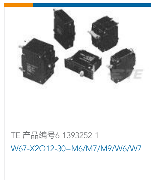
TE 产品编号6-1393252-1 W67-X2Q12-30=M6/M7/M9/W6/W7