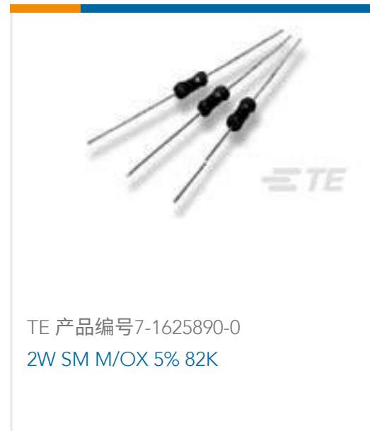
TE 产品编号7-1625890-0 2W SM M/OX 5% 82K