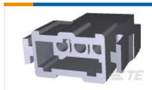
TE 产品编号207359-1 RECEPT HSG,3 POSN,METRIC