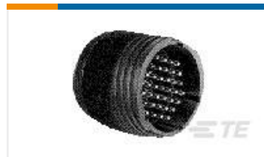
TE 产品编号206151-2 23-37 F.H. RECEPT