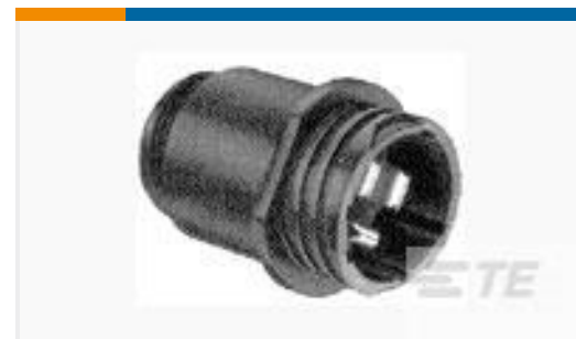
TE 产品编号206207-1 17-3 RECEPT. FREE-HANGING