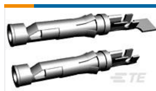
TE 产品编号66101-2 III+ SKT,18-16,TIN-LEAD,LP