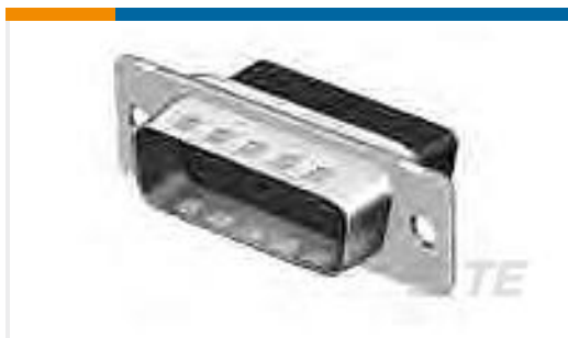
TE 产品编号207464-7 HDP-20,PLUG,SIZE 3, 25 POSN