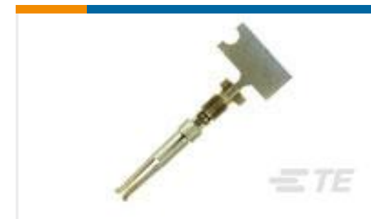
TE 产品编号745253-6 20 DF SOCKET CONT L.P.