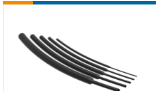
TE 产品编号NB12744001 RNF-100-BK 热缩管