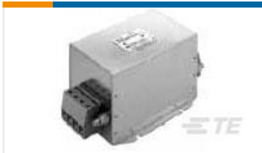
TE 产品编号6609067-1 16AYC10B=F7745D