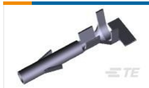
TE 产品编号350537-1 UMNL SOK 20-14 .0126 PTPBR