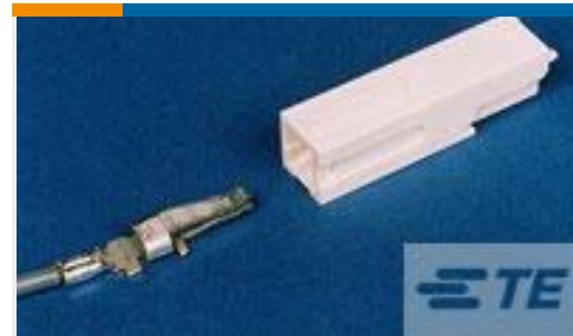
TE 产品编号556137-2 HSG,AMPINNERGY WTW,1 POS, BLACK