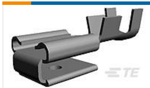
TE 产品编号61944-2 250 FASTON REC 18-14 AWG TPBR