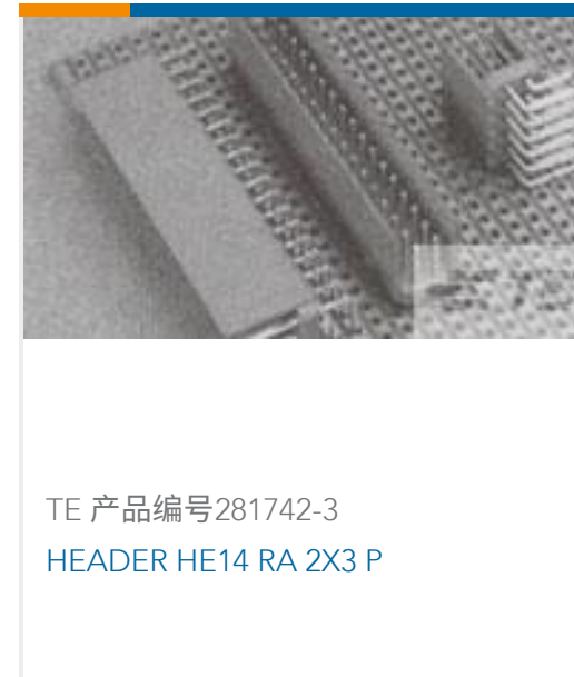
TE 产品编号281742-3 HEADER HE14 RA 2X3 P