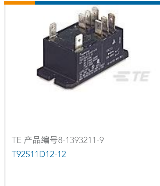
TE 产品编号8-1393211-9 T92S11D12-12