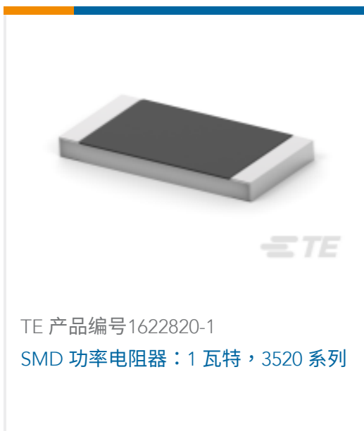
TE 产品编号1622820-1 SMD 功率电阻器: 1 瓦特, 3520 系列