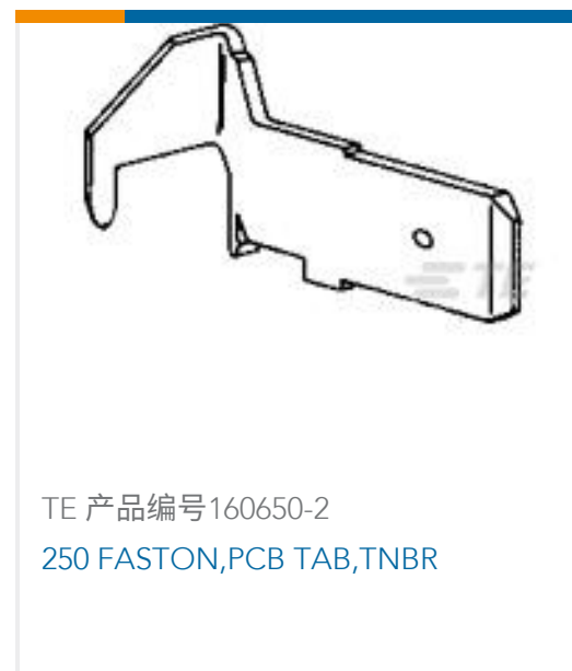
TE 产品编号160650-2 250 FASTON,PCB TAB,TNBR