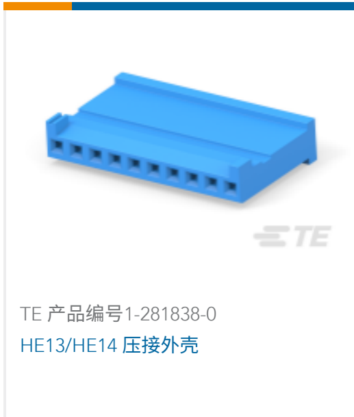
TE 产品编号1-281838-0 HE13/HE14 压接外壳