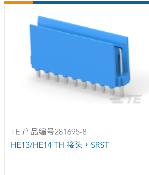
TE 产品编号281695-8 HE13/HE14 TH 接头, SRST