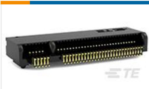
TE 产品编号2199119-8 M.2 0.5PITCH 3.2H KEY A 15U" AU