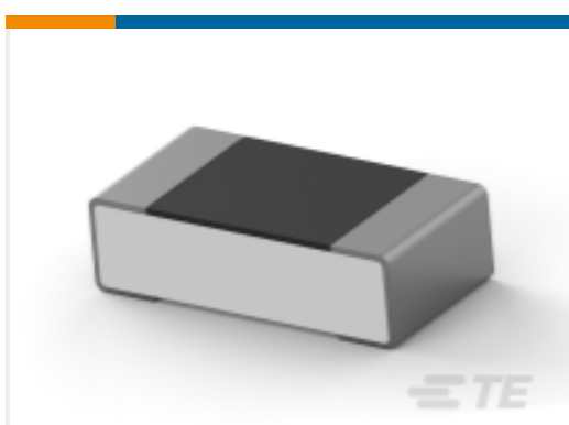
TE 产品编号9-2176369-7 RQ 0603 402R 0.1% 10PPM 5K RL