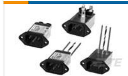
TE 产品编号1-6609016-5 6ED8C=F7541 S0