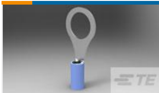
TE 产品编号328999 TERMINAL,PIDG R 16-14 3/8