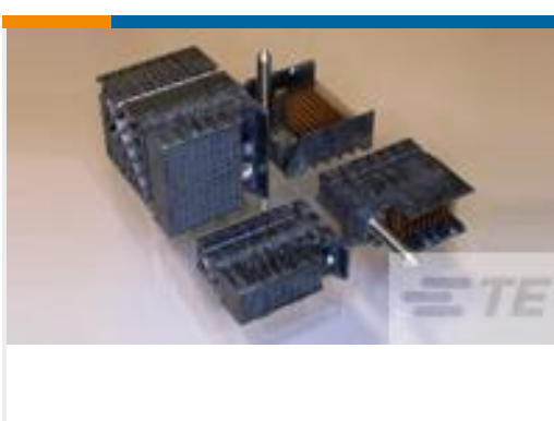
TE 产品编号2143310-3 IMP100S,H,RA2P16C,UG,LEW39,5,5