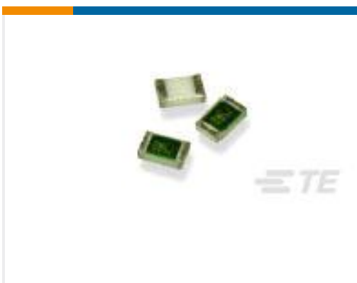
TE 产品编号4-1879214-9 CPF 0402 1K07 0.1% 25PPM 1K RL