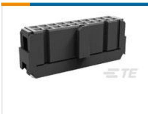
TE 产品编号1-1658621-2 64 NOVO MIL/CTR 15DP,LEAD FREE