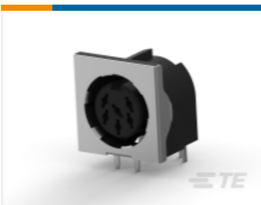
TE 产品编号5212045-1 6 CIRC DIN RCPT GRND SHLD