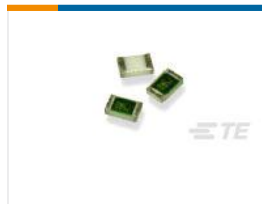
TE 产品编号8-1879338-5 CPF 0603 200K 1% 50PPM 1K RL