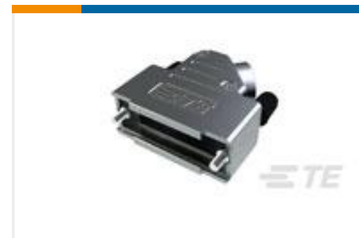
TE 产品编号3-2198618-7 Ni Pltd Plstic Backshell, 37 Way, 45 Deg