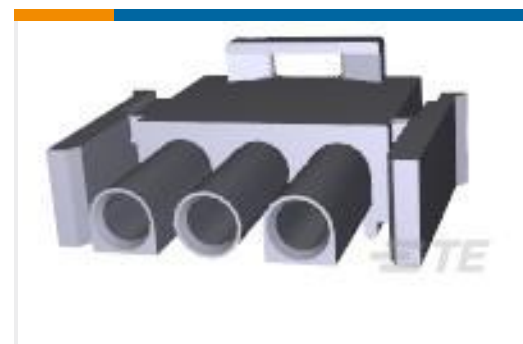
TE 产品编号1-480700-2 03P UMNL PLUG HSG RED