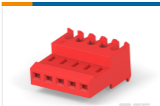
TE 产品编号3-641191-6 Nylon Gold Plated Receptacle: 2.54 mm, no Mating Alignment