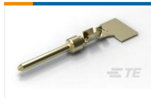
TE 产品编号1658540-4 CONT,PIN,PLATED,20DF,STRIP,#24