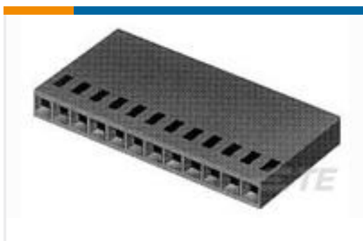
TE 产品编号1-87499-7 10 MODIV HSG SR MRKD .100CL