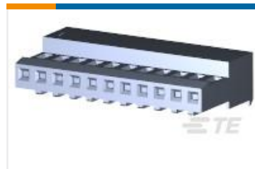
TE 产品编号4-640440-1 11P MTA100 CONN ASSY 22AWG RED