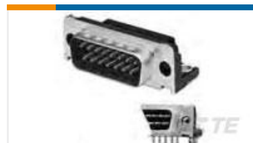
TE 产品编号747250-4 09 MSFL PLUG RA 318 (IN,FM)