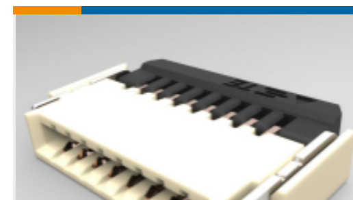
TE 产品编号2328702-6 6PIN 0.5MMP FPC CONNECTOR, BACK FLIP LOCK