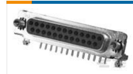
TE 产品编号5745783-5 25 MSFL RCPT RA 318 (SL,FM)