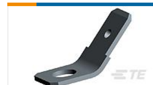
TE 产品编号140814-2 250 FASTON,TAB,TPBR