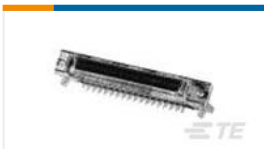
TE 产品编号5787190-5 50 50SR R/A RCPT ASSY,RDSN L/F