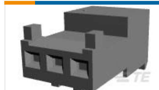
TE 产品编号3-643814-3 03P MTA100 CONN ASSY POL RIB