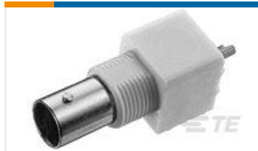
TE 产品编号5227222-1 VERT JK W/MTG PINS, BNC PCB