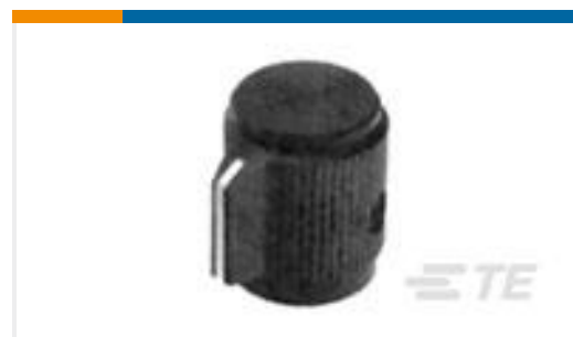
TE 产品编号9-1437622-6 KPN700B1/4=KNOB BLK W/POINTER