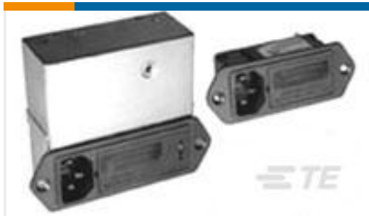
TE 产品编号2-6609129-8 SEFM4S=F8112