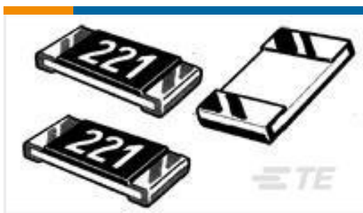
TE 产品编号1622820-2 3520 100R 5%