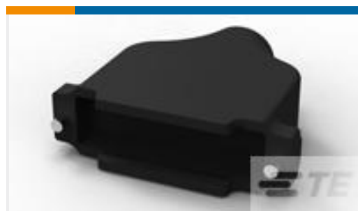
TE 产品编号5748677-3 PLTD PLST CBL CLMP KIT,SZ 3