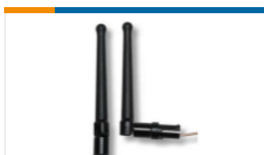
TE 产品编号MAF94051 Dipol,WTS,BLACK,RSMAM 802.11abg, 2dBi,BCr