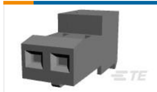
TE 产品编号3-640441-2 02P MTA100 CONN ASSY WHT