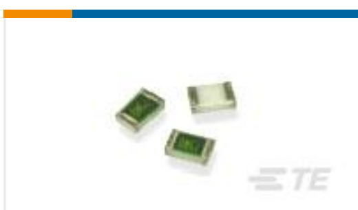
TE 产品编号1676379-2 RN 0805 576R 0.1% 10PPM 1KRL