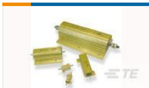
TE 产品编号7-1625966-9 HSA10 12R 5%