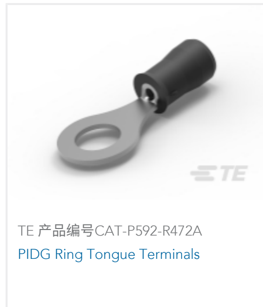
TE 产品编号CAT-P592-R472A PIDG Ring Tongue Terminals