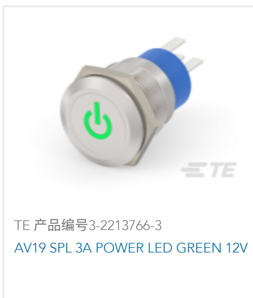
TE 产品编号3-2213766-3 AV19 SPL 3A POWER LED GREEN 12V