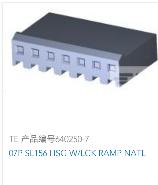
TE 产品编号640250-7 07P SL156 HSG W/LCK RAMP NATL