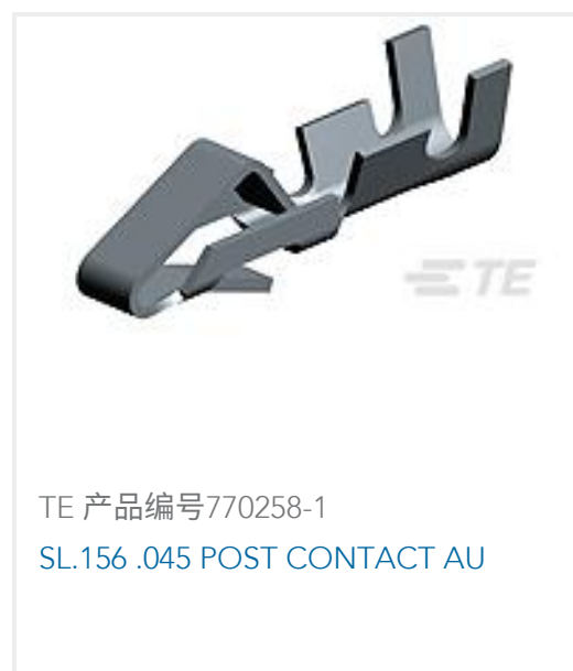
TE 产品编号770258-1 SL.156 .045 POST CONTACT AU