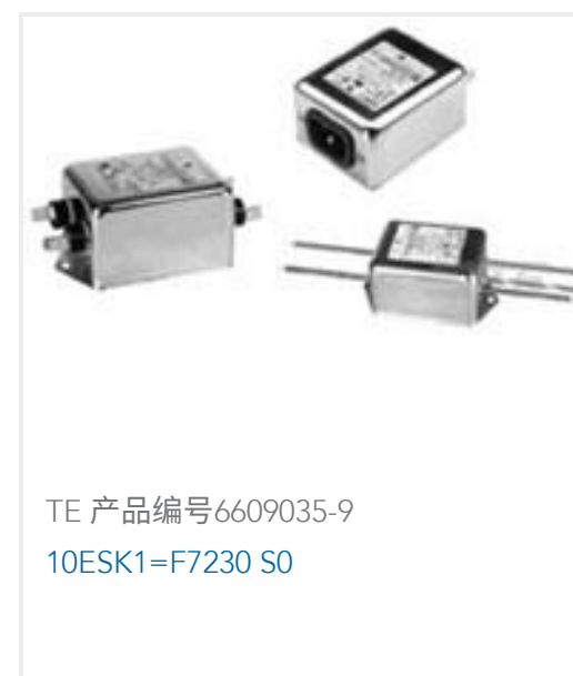
TE 产品编号6609035-9 10ESK1=F7230 S0