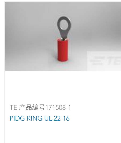
TE 产品编号171508-1 PIDG RING UL 22-16