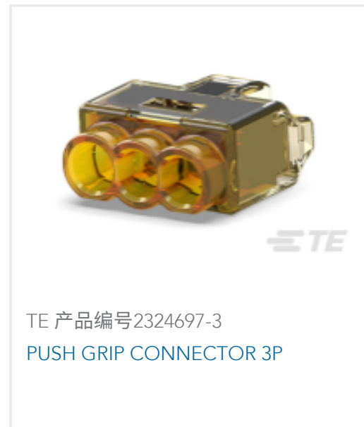
TE 产品编号2324697-3 PUSH GRIP CONNECTOR 3P