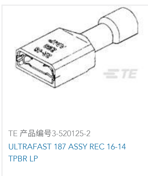
TE 产品编号3-520125-2 ULTRAFast 187 ASSY REC 16-14 TPBR LP