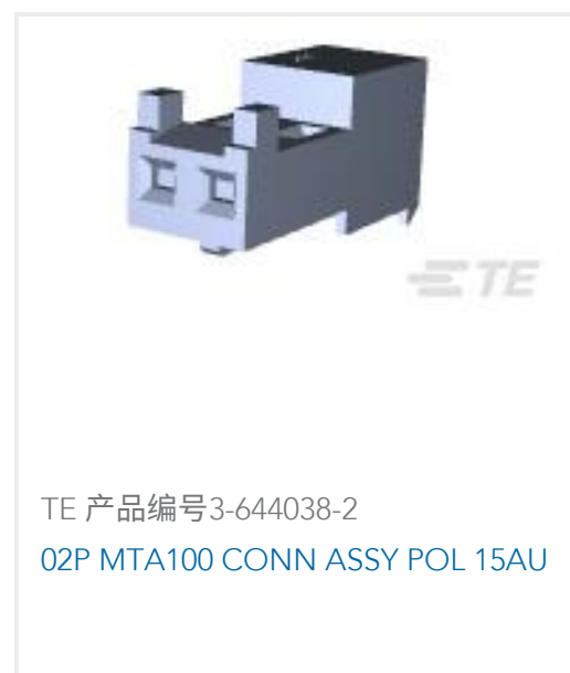
TE 产品编号3-644038-2 02P MTA100 CONN ASSY POL 15AU