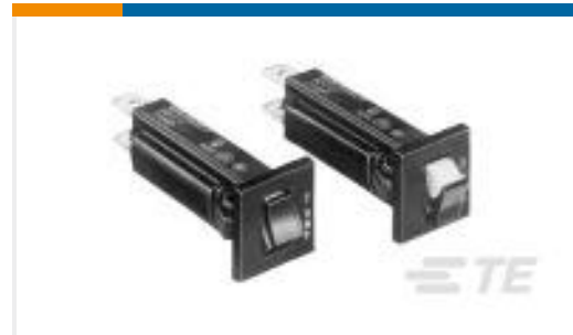
TE 产品编号1-1393250-9 W28-XQ1A-0.25=W28