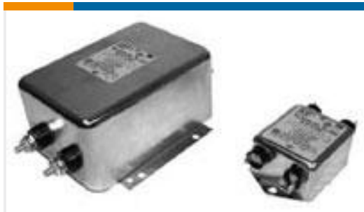
TE 产品编号2-6609037-0 10EMC3=F8148