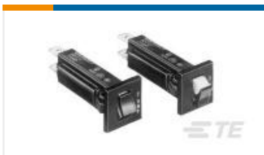
TE 产品编号2-1393250-1 W28-XQ1A-0.50=W28