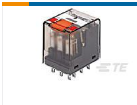
TE 产品编号4-1419111-8 PT270524