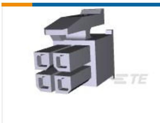
TE 产品编号794617-4 4POS,MICRO MNL,RCPT HSG