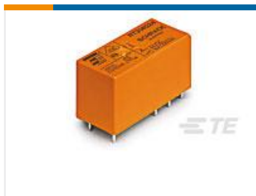
TE 产品编号7-1393239-3 RT31L012