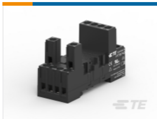
TE 产品编号4-1415033-1 PT78740