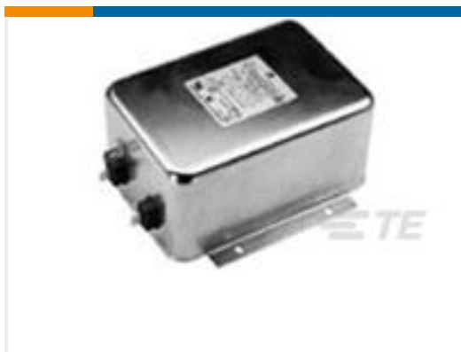
TE 产品编号6609046-4 6ET1=F7003 S0