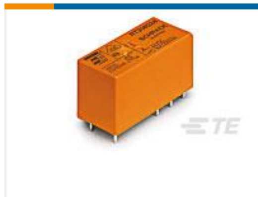
TE 产品编号7-1393243-9 RT424730