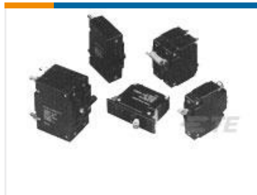
TE 产品编号3-1393253-8 W68-X2Q12-5=M6/M7/M9/W6/W7