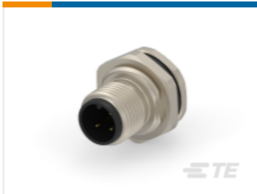
TE 产品编号T4171010003-001 M12,REAR MOUNTING,MALE,A,3P,0.2 M WIRE