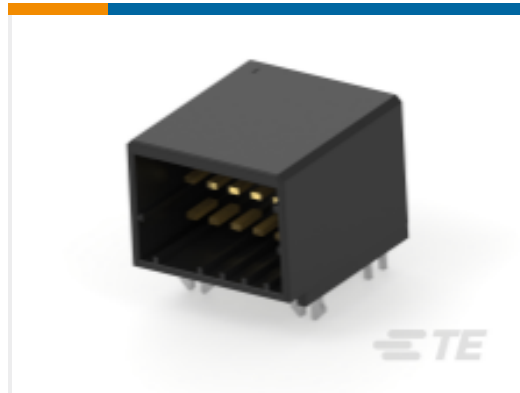
TE 产品编号1318126-1 Dynamic 2000 HDR 组件