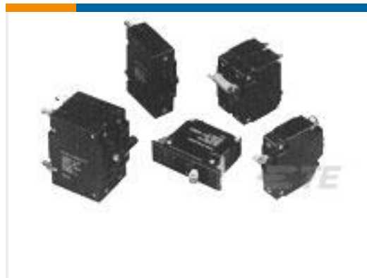
TE 产品编号2-1393253-9 W68-X2Q12-10=M6/M7/M9/W6/W7