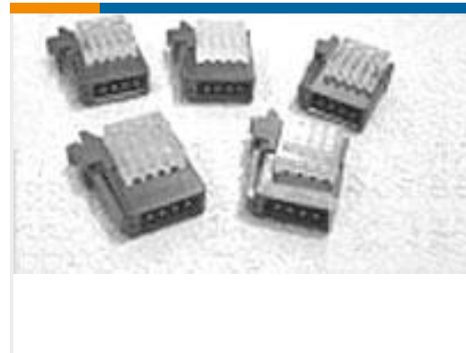
TE 产品编号1473562-3 RITS CONN. PLUG ASSY 3P YELLOW