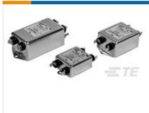
TE 产品编号1-1609034-9 20VSB1=F8333