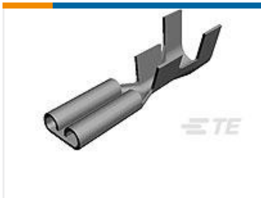
TE 产品编号61158-1 110 FASTON REC 22-18 AWG TPBR