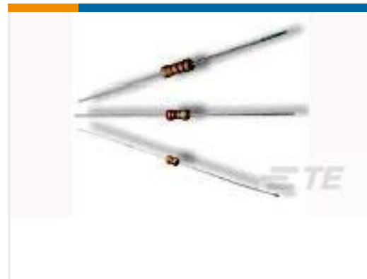
TE 产品编号3-1623932-9 CFR50 5% 1K2