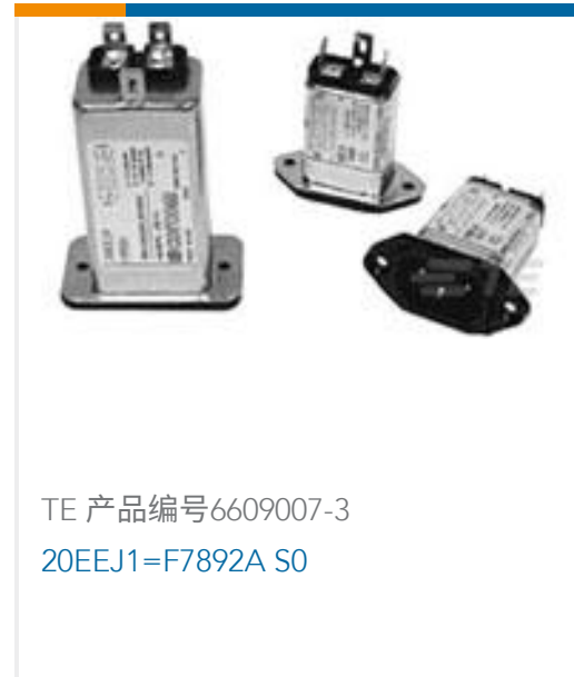
TE 产品编号6609007-3 20EEJ1=F7892A S0