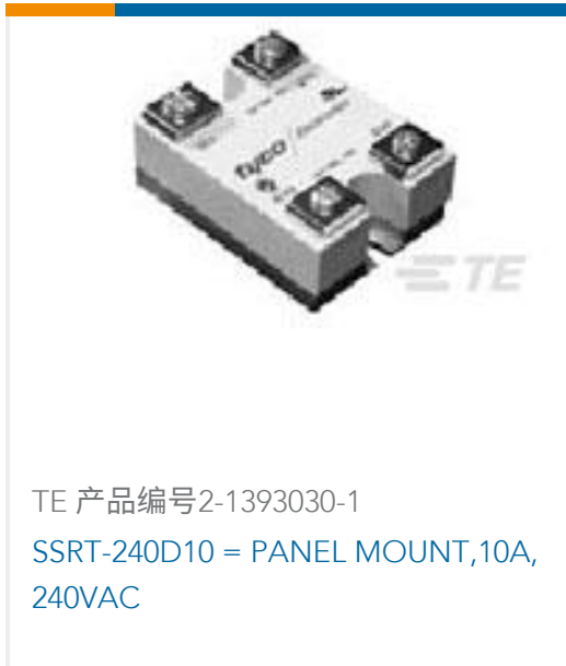
TE 产品编号2-1393030-1 SSRT-240D10 = PANEL MOUNT,10A, 240VAC