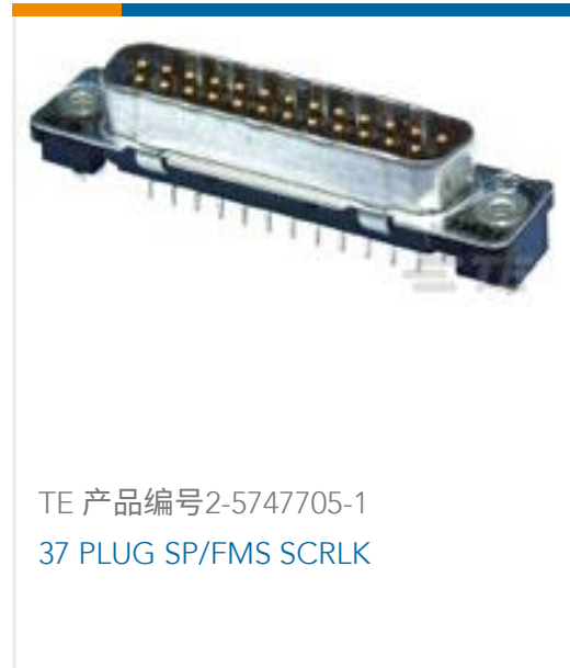
TE 产品编号2-5747705-1 37 PLUG SP/FMS SCRLK