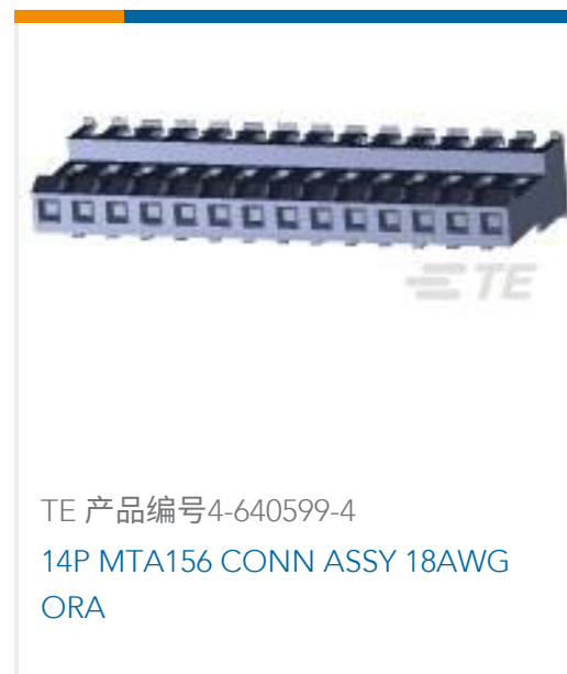
TE 产品编号4-640599-4 14P MTA156 CONN ASSY 18AWG ORA