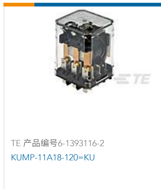
TE 产品编号6-1393116-2 KUMP-11A18-120=KU