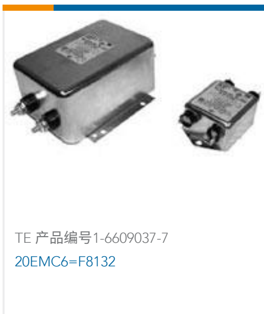
TE 产品编号1-6609037-7 20EMC6=F8132