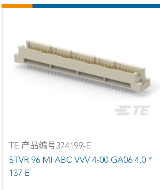
TE 产品编号374199-E STVR 96 MI ABC VVV 4-00 GA06 4,0 * 137 E