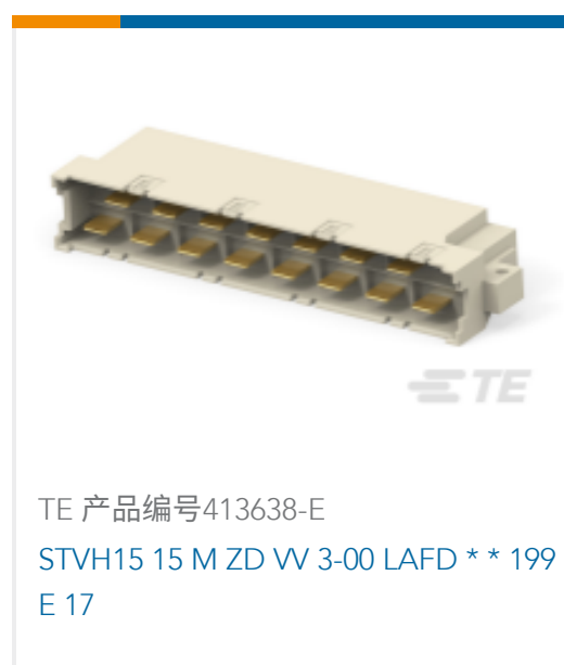
TE 产品编号413638-E STVH15 15 M ZD VV 3-00 LAFD ** 199 E 17