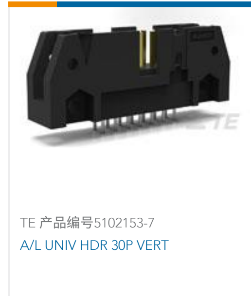
TE 产品编号5102153-7 A/L UNIV HDR 30P VERT