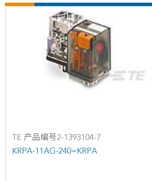
TE 产品编号2-1393104-7 KRPA-11AG-240=KRPA