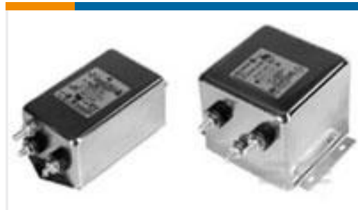
TE 产品编号1-6609036-6 40VSK6=F7775 S0