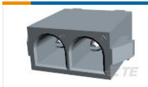
TE 产品编号350787-1 02P UMNL PIN HDR ASSY 94VO