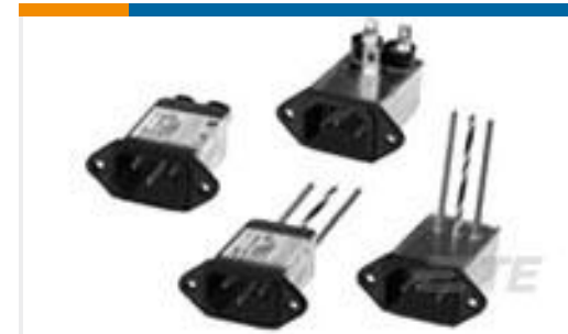
TE 产品编号1-6609016-9 15ED8=F7802 S0