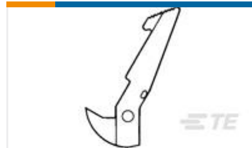
TE 产品编号102312-2 UNIVERSAL HEADER LATCH