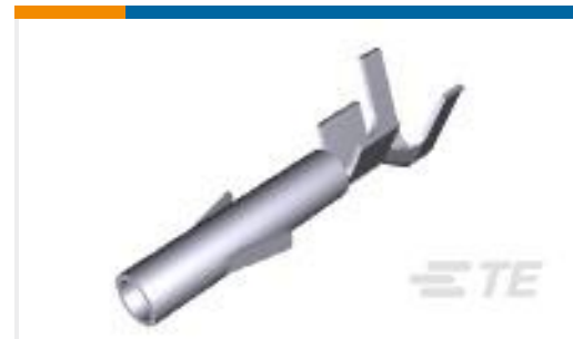
TE 产品编号350551-1 UMNL SOK 20-14 PTPBR L/P