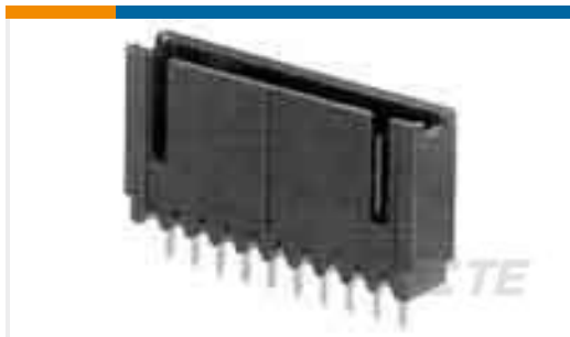
TE 产品编号5-102202-3 06 MODII HDR SRST SHRD LF