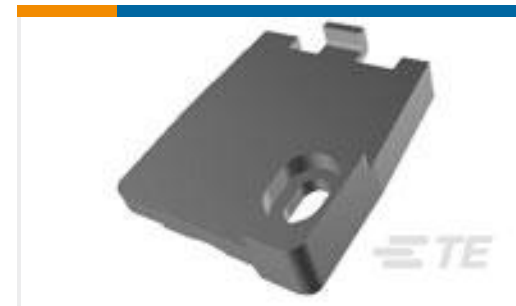
TE 产品编号640714-1 03P UMNL STR/REL