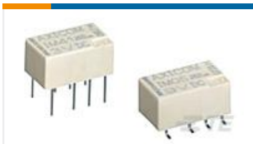
TE 产品编号3-1462039-8 IM06DTS=IM RELAY 140mW 12V