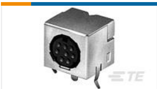
TE 产品编号1658998-1 Mini DIN, 8 pos, R/A, Shield