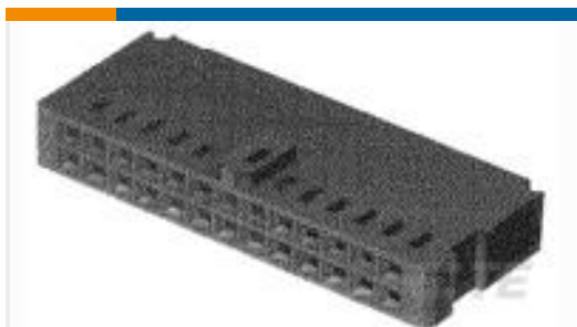
TE 产品编号102387-3 16 MODIV HSG COMP DR .100 POL