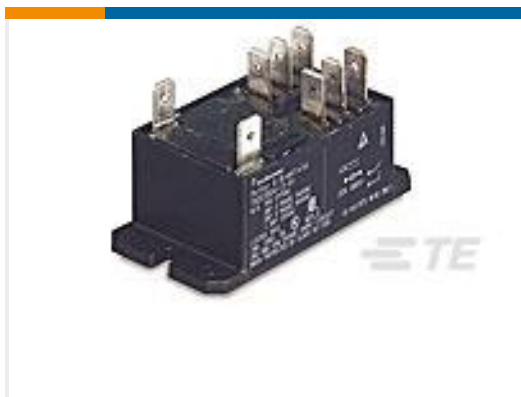
TE 产品编号4-1393211-6 T92P11A22-277