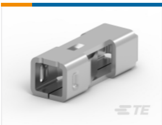
TE 产品编号2834171-3 ULTRAMINIATURE SLIM CONTACT