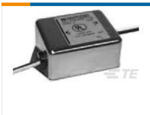
TE 产品编号2-6609092-3 3FL3=F5198