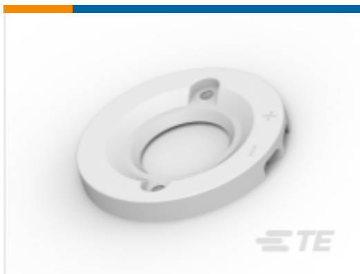
TE 产品编号2213382-2 Z50 Zhaga Profile LED Holders