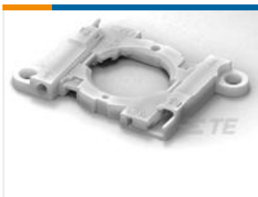
TE 产品编号2174024-1 LUMAWISE LED HOLDER, TYPE NL2