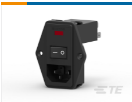
TE 产品编号9-6609955-2 PE0S0D000=C4906