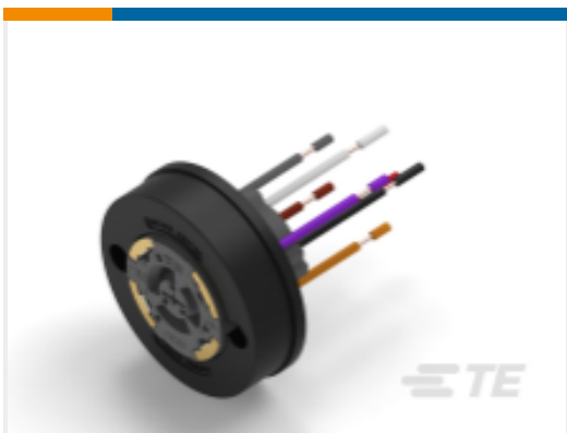
TE 产品编号2213627-2 ASSEMBLY, ROT DIM REC 49.22MM 7 POS 150C