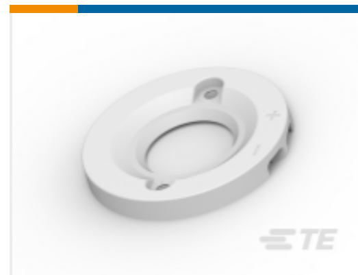
TE 产品编号2213382-2 Z50 Zhaga Profile LED Holders