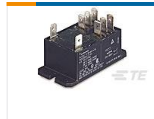
TE 产品编号4-1393211-6 T92P11A22-277