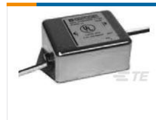
TE 产品编号2-6609092-3 3FL3=F5198