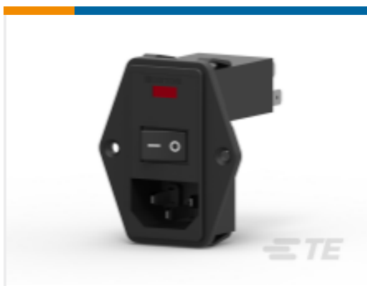
TE 产品编号9-6609955-2 PEOSOD000=C4906