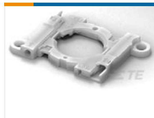
TE 产品编号2174024-1 LUMAWISE LED HOLDER, TYPE NL2