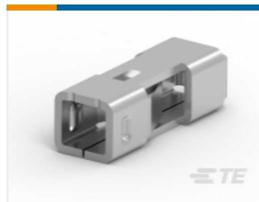
TE 产品编号2834171-3 ULTRAMINIATURE SLIM CONTACT