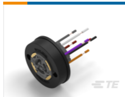
TE 产品编号2213627-2 ASSEMBLY, ROT DIM REC 49.22MM 7 POS 150C