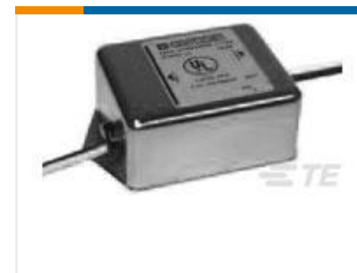
TE 产品编号2-6609092-3 3FL3=F5198