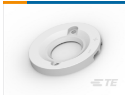
TE 产品编号2213382-2 Z50 Zhaga Profile LED Holders