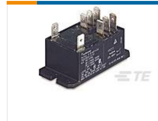
TE 产品编号4-1393211-6 T92P11A22-277