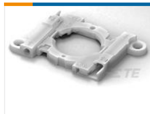
TE 产品编号2174024-1 LUMAWISE LED HOLDER, TYPE NL2