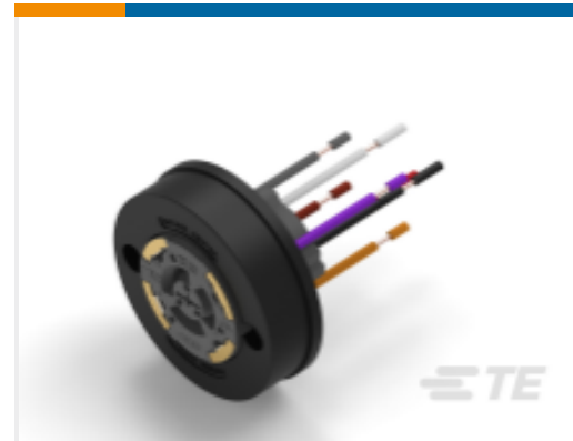
TE 产品编号2213627-2 ASSEMBLY, ROT DIM REC 49.22MM 7 POS 150C