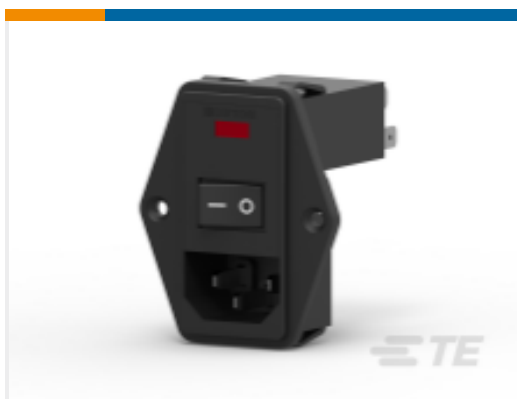
TE 产品编号9-6609955-2 PE0S0D000=C4906