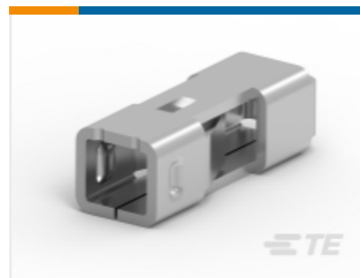
TE 产品编号2834171-3 ULTRAMINIATURE SLIM CONTACT