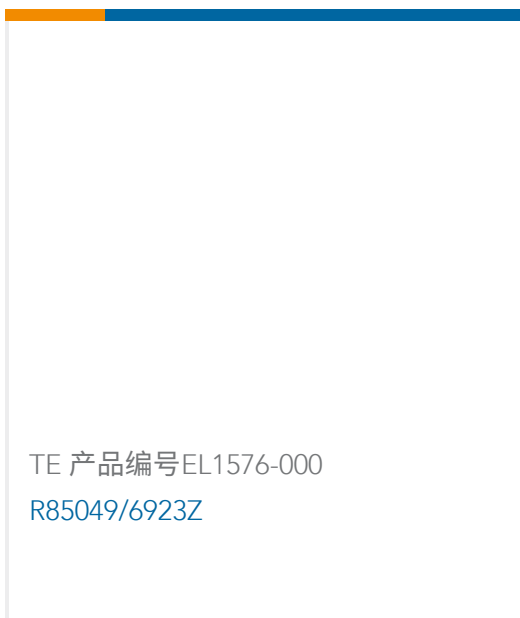
TE 产品编号EL1576-000 R85049/6923Z