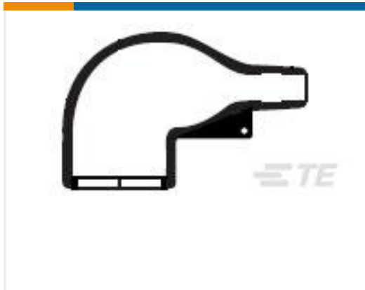
TE 产品编号502596-000 222K132-100-0