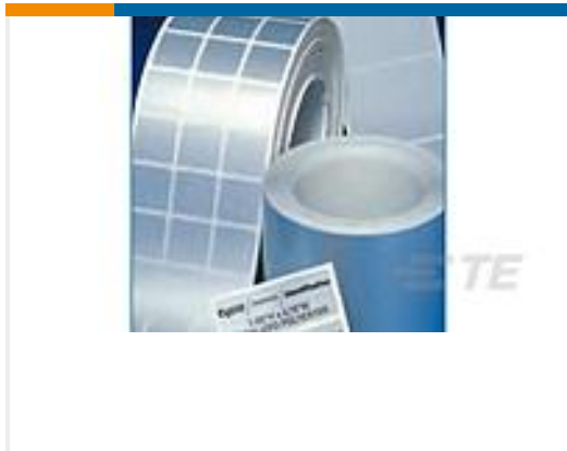
TE 产品编号F97088-000 WP-762508-2.5-9