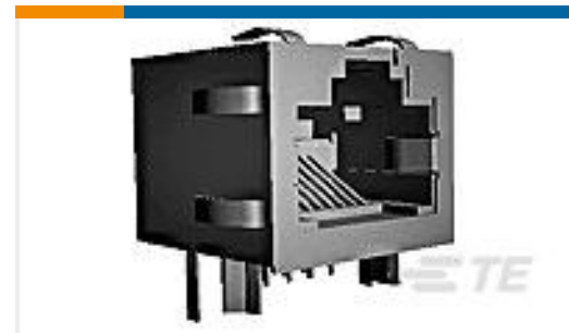
TE 产品编号1-406541-6 MJ,INV,1X1,6PNL G,.140"ST,SN