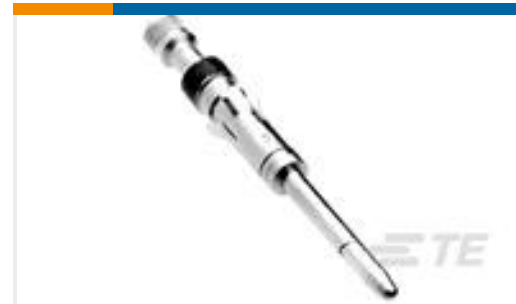
TE 产品编号200336-1 CONTACT PIN ASSY.