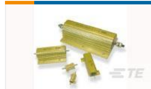
TE 产品编号1625966-4 HSA10 10R 5%