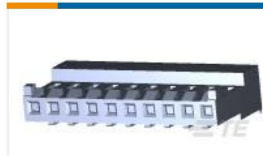
TE 产品编号4-643817-0 10P MTA156 CONN ASSY 18AWG LF