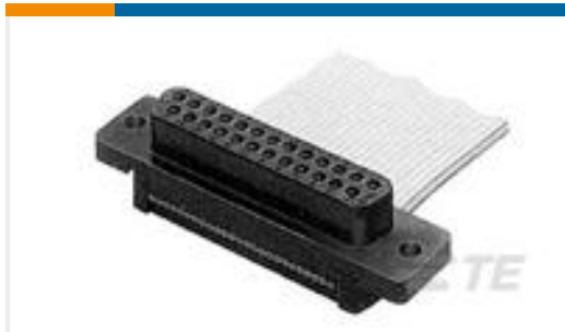
TE 产品编号1658614-4 09 POS HDF RCPT, AP, LEAD FREE