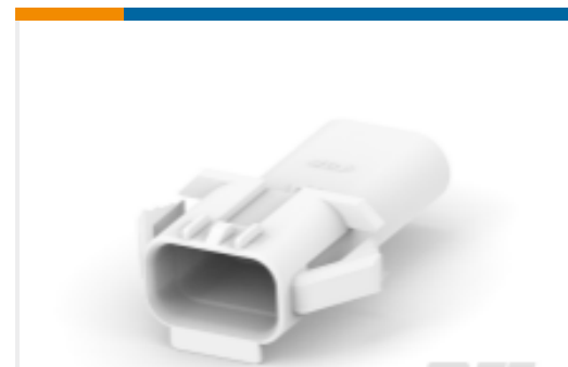
TE 产品编号2321926-3 RECEPTACLE HOUSING PANEL MOUNT 3PIN