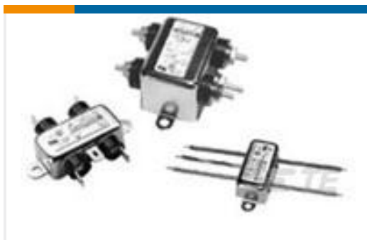
TE 产品编号6609020-8 5EB3=F7105 S0