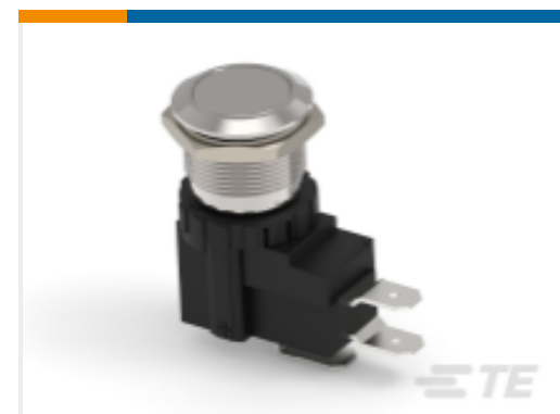
TE 产品编号2364569-1 AVH19 FLT SS MT NO LED 26A