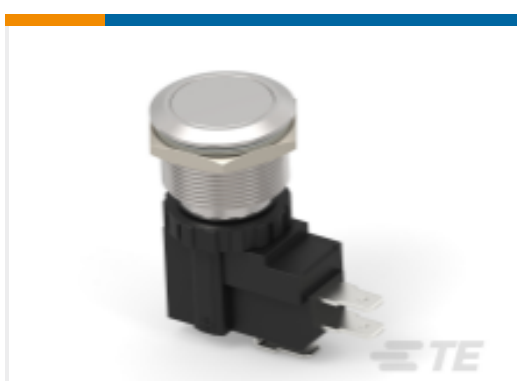
TE 产品编号2364684-1 AVH22 FLT SS MT NO LED 16A