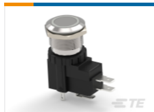
TE 产品编号2364570-8 AVH19 FLT SS LK RNG RED 24V16A