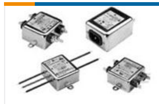
TE 产品编号1-6609028-1 5VK7=F7141 S0