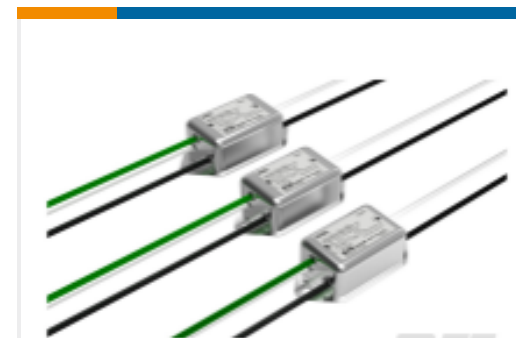
TE 产品编号6-1609091-4 Single Phase Filters, Corcom FB Series