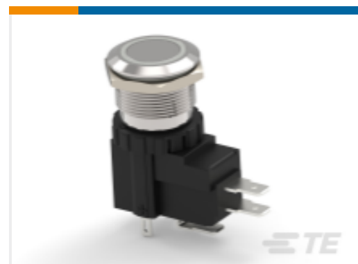
TE 产品编号1-2364570-5 AVH19 FLT SS MT RNG GRN 24V16A