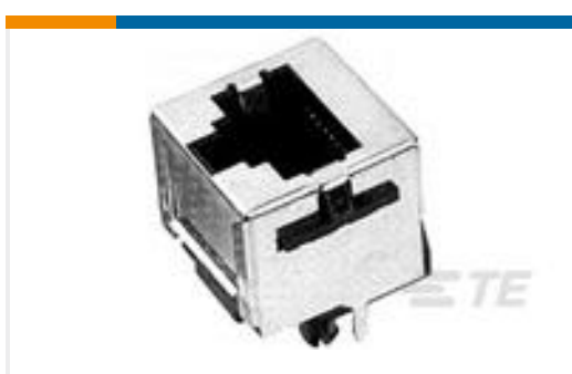
TE 产品编号5557969-2 MJ,TE,8P/8C,SHLD,PNL STOPS&G