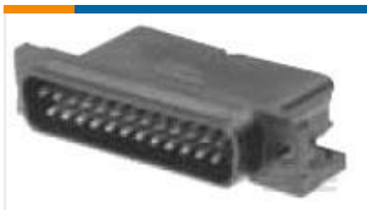
TE 产品编号5748873-1 AMP III PLUG 25P RA 590 THD IN