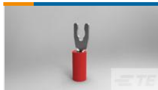
TE 产品编号52929 PIDG SP SPD 22-16COMM22-18MIL6