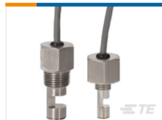
TE 产品编号LL01-1AB04 LL01 1/2" NPT 48" CABLE 80C