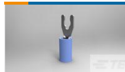
TE 产品编号52935-2 TERMINAL,PIDG SPR SPD 16-14 6