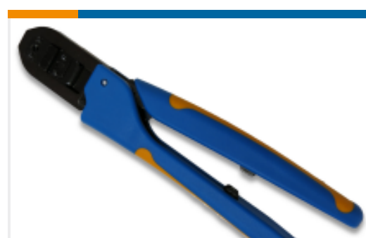
TE 产品编号2326267-1 CCII AMPMODU 2MM REC 28-24 ASSY