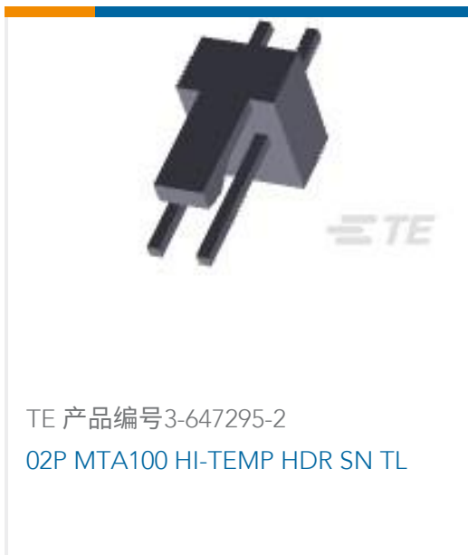
TE 产品编号3-647295-2 02P MTA100 HI-TEMP HDR SN TL