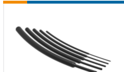
TE 产品编号NB13542001 RNF-100-3/8-BK-STK