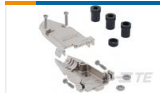
TE 产品编号5748676-1 DIE CAST CBL CLMP KIT,SZ 1