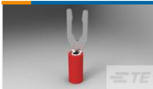
TE 产品编号52410 PIDG SP SPD 22-16COMM22-18MIL8