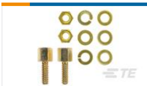
TE 产品编号5205817-1 KIT SCREWLOCK FEMALE