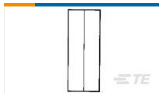
TE 产品编号34130 SPLICE,SOLIS PARA 22-16