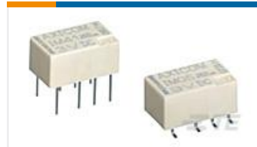
TE 产品编号9-1462037-9 IM06CGR=IM RELAY 140mW12V HDV