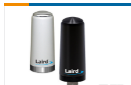
TE 产品编号TRA6927M3PW-001 OMNI,DB,Ph,698/1710 MHz WHT,3 dBi,100W,