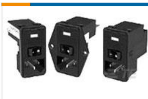
TE 产品编号4-1609156-0 PM0S0SM6E=C7114