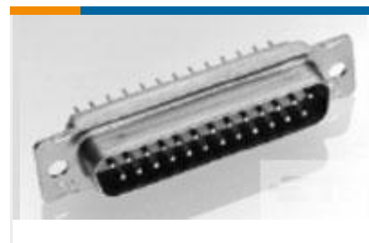
TE 产品编号443975-4 AMPLIMITE,RCPT ASY,POSTD,109,4