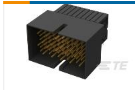
TE 产品编号2102081-2 Fortis Zd 2Pr 10Col R/A Full Shroud Assy