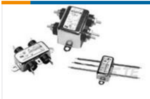
TE 产品编号6609020-7 5EB1=F7104 S0