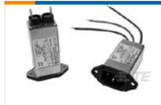
TE 产品编号2-6609006-9 10EJT8=F8144