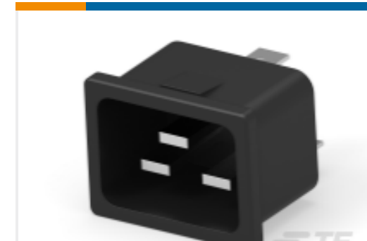
TE 产品编号4-1609134-8 20ESRMC2=F8278