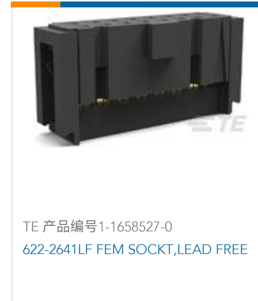
TE 产品编号1-1658527-0 622-2641LF FEM SOCKET, LEAD FREE