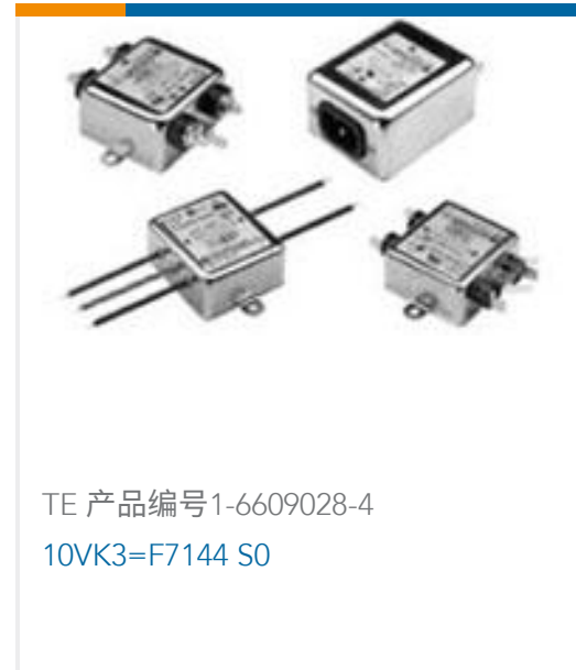
TE 产品编号1-6609028-4 10VK3=F7144 S0