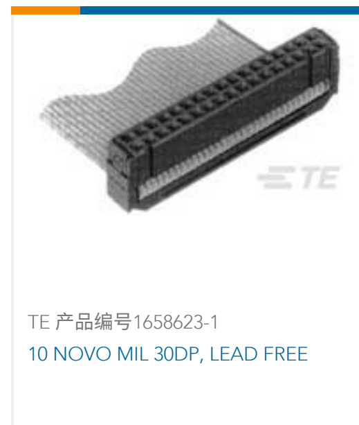
TE 产品编号1658623-1 10 NOVO MIL 30DP, LEAD FREE