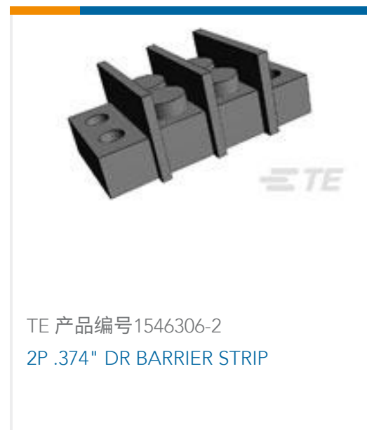
TE 产品编号1546306-2 2P .374" DR BARRIER STRIP