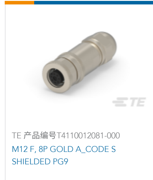
TE 产品编号T4110012081-000 M12 F, 8P GOLD A_CODE S SHIELDED PG9