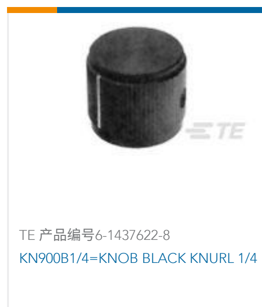
TE 产品编号6-1437622-8 KN900B1/4=KNOB BLACK KNURL 1/4