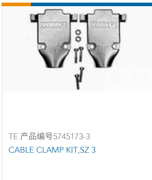
TE 产品编号5745173-3 CABLE CLAMP KIT, SZ 3