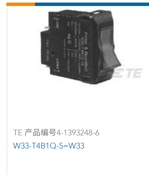
TE 产品编号4-1393248-6 W33-T4B1Q-5=W33