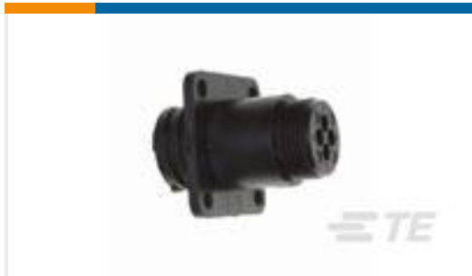
TE 产品编号206061-1 RECPT, SZ 11-4, CPC