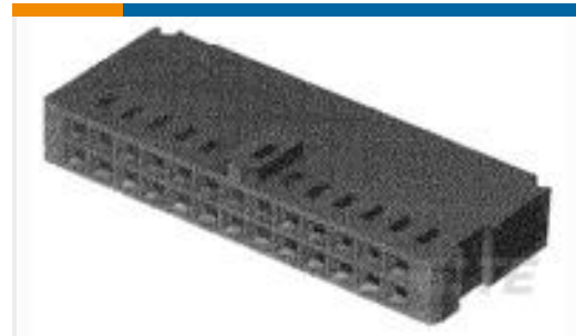
TE 产品编号102387-6 26 MODIV HSG COMP DR .100 POL