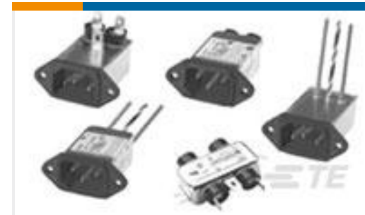
TE 产品编号6609012-1 3EH1=F7645 S0