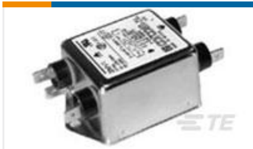
TE 产品编号6609056-1 3MV1=F7756 S0