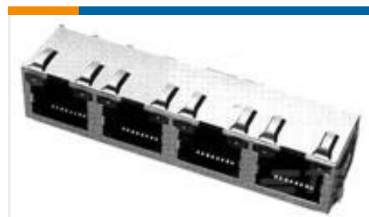
TE 产品编号5406552-1 INV MJ,1X4,PNL GRD, LED (G/Y)