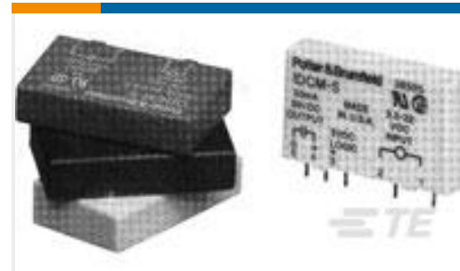
TE 产品编号3-1393028-1 OACM-U = SLIM PCB MONT,3A, 120VAC-DC I/p