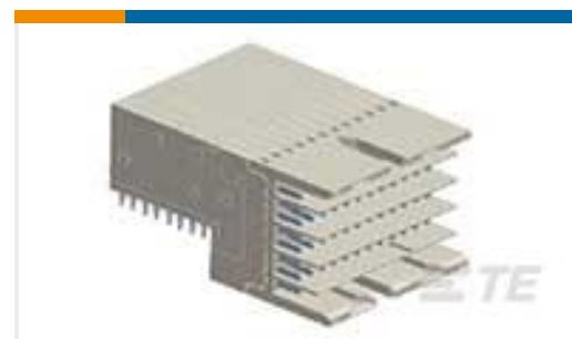
TE 产品编号2042162-1 Right Angle Male Connector