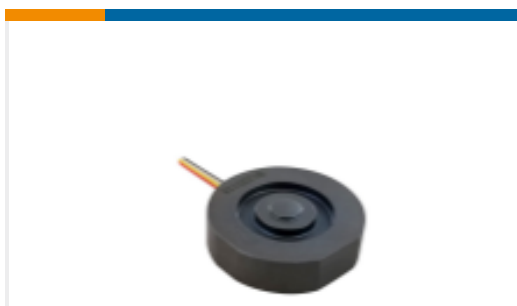
TE 产品编号20009605-23 FX29K0-100A-0100-L