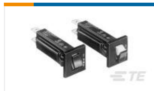
TE 产品编号1-1393250-9 W28-XQ1A-0.25=W28