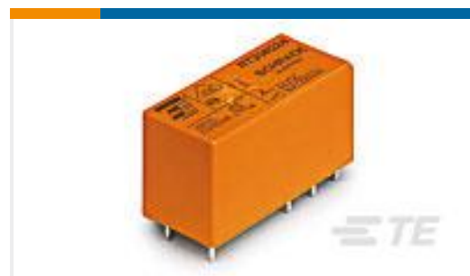
TE 产品编号7-1393243-6 RT424524