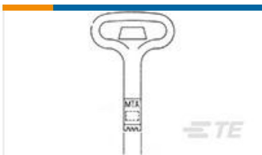
TE 产品编号59804-1 MAINTENANCE TOOL