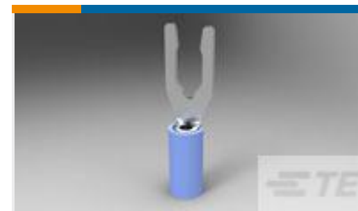
TE 产品编号52421-3 TERMINAL, PIDG SPR SPD 16-14 8