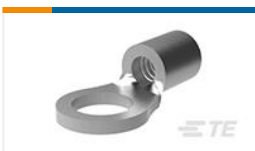
TE 产品编号2-34104-6 SOLIS R 22-16 COMM 22-18 MIL 4