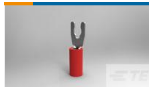
TE 产品编号52929-1 PIDG SP SPD 22-16 COMM 22-18 MIL 6