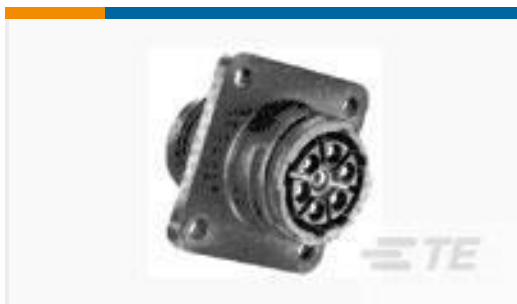
TE 产品编号211398-4 CPC RECPT. SIZE 13-7, THRD INST