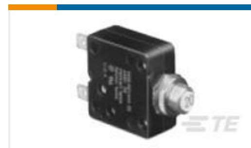
TE 产品编号1-1393249-8 W58-XB1A4A-4=W58