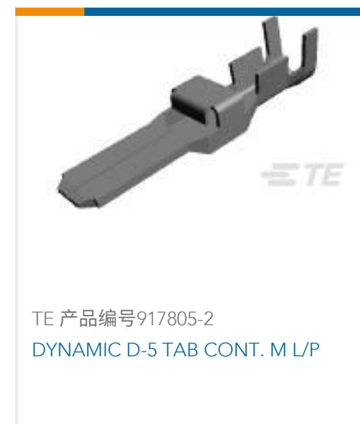
TE 产品编号917805-2 DYNAMIC D-5 TAB CONT. M L/P