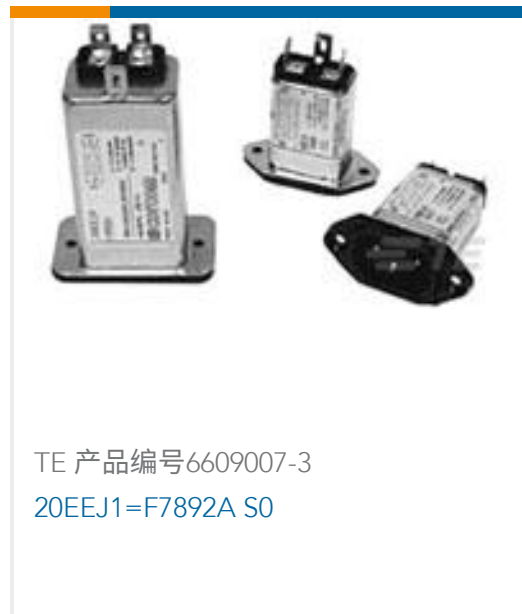
TE 产品编号6609007-3 20EEJ1=F7892A S0