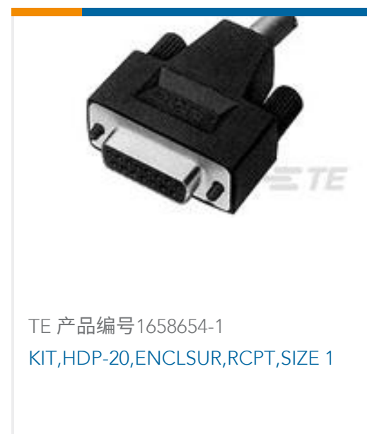
TE 产品编号1658654-1 KIT,HDP-20,ENCLSUR,RCPT,SIZE 1