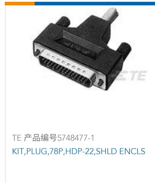
TE 产品编号5748477-1 KIT,PLUG,78P,HDP-22,SHLD ENCLS