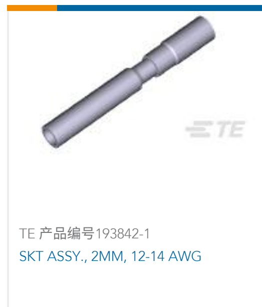
TE 产品编号193842-1 SKT ASSY., 2MM, 12-14 AWG