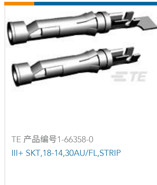
TE 产品编号1-66358-0 III+ SKT,18-14,30AU/FL,STRIP