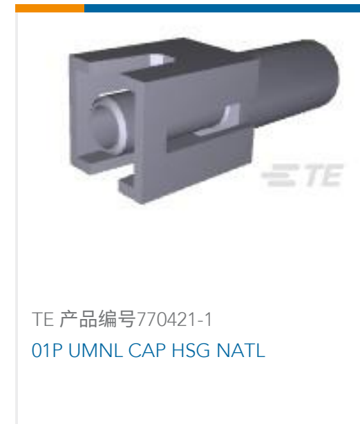
TE 产品编号770421-1 01P UMNL CAP HSG NATL