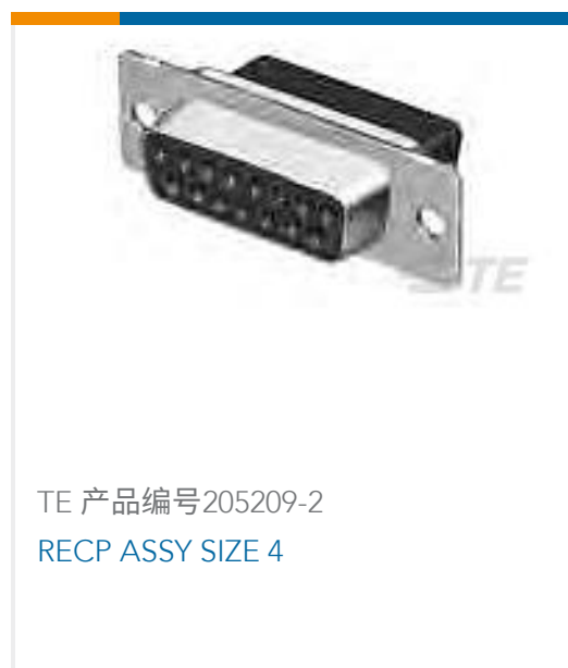
TE 产品编号205209-2 RECP ASSY SIZE 4