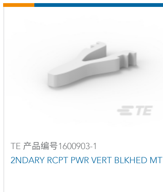
TE 产品编号1600903-1 2NDARY RCPT PWR VERT BLKHED MT