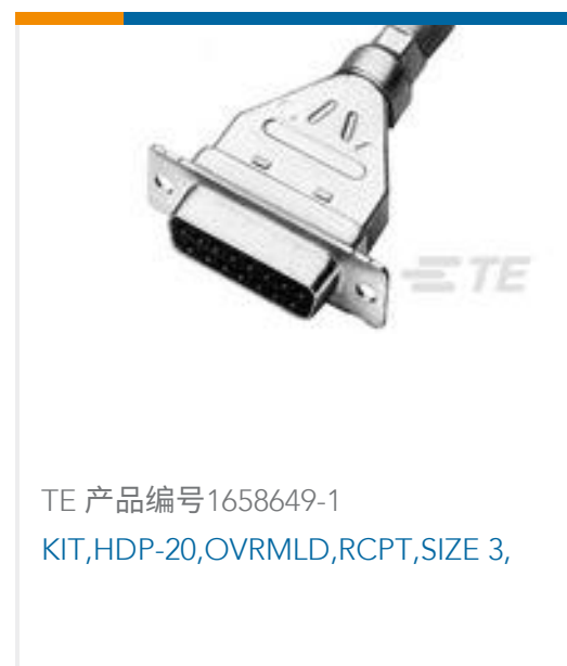
TE 产品编号1658649-1 KIT,HDP-20,OVRMLD,RCPT,SIZE 3,