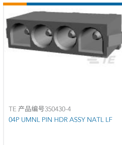
TE 产品编号350430-4 04P UMNL PIN HDR ASSY NATL LF