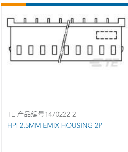
TE 产品编号1470222-2 HPI 2.5MM EMIX HOUSING 2P