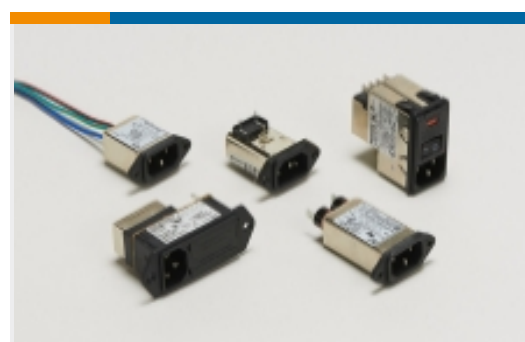
多功能插口式滤波器(32)