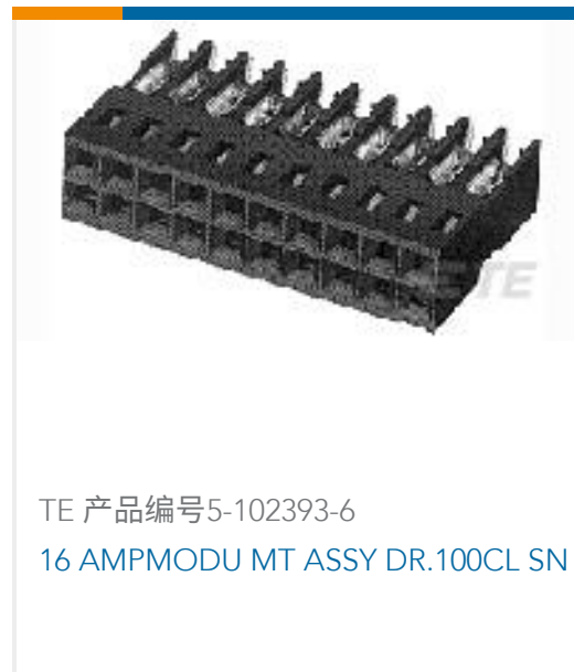
TE 产品编号5-102393-6 16 AMPMODU MT ASSY DR.100CL SN