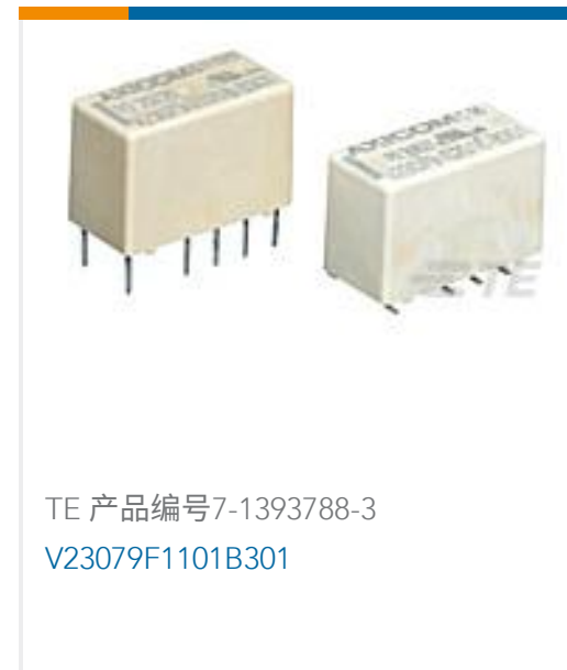
TE 产品编号7-1393788-3 V23079F1101B301