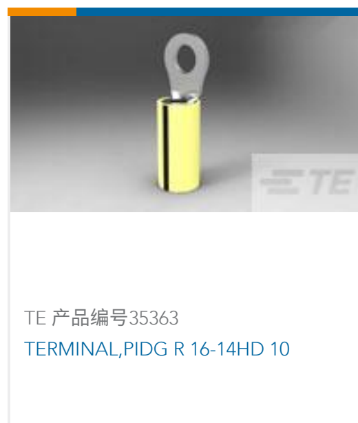
TE 产品编号35363 TERMINAL,PIDG R 16-14HD 10