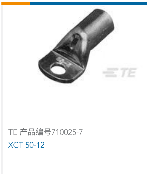
TE 产品编号710025-7 XCT 50-12