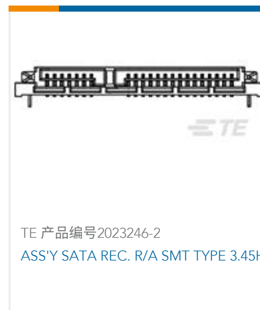
TE 产品编号2023246-2 ASS'Y SATA REC. R/A SMT TYPE 3.45H