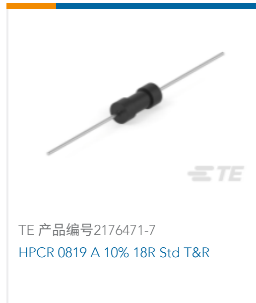
TE 产品编号2176471-7 HPCR 0819 A 10% 18R Std T&R