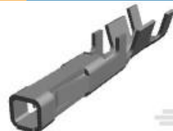
TE 产品编号1-794610-2 MICRO MNL RPT CNT,LS PC 30AU L