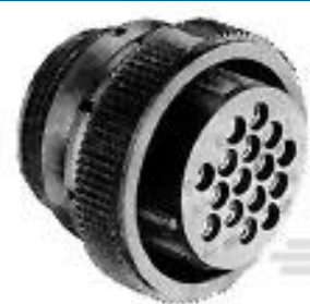
TE 产品编号182651-1 CPC Plug Assy, 11-4, Rev Sex