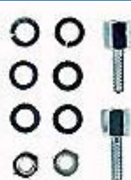
TE 产品编号5207719-1 KIT SCREWLOCK FEMALE