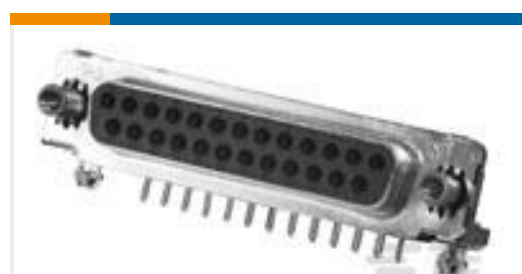
TE 产品编号747844-6 09 MSFL RCPT RA 318 (SL,FM,BL)