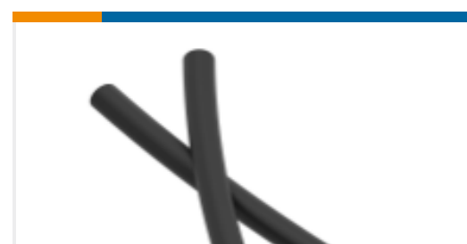
TE 产品编号NB14032001 TAT-125-3/16-0-STK