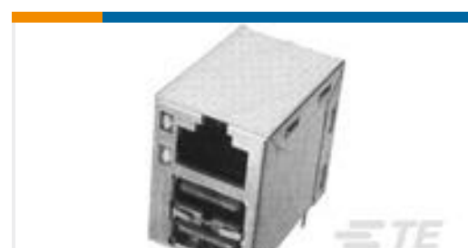
TE 产品编号6116151-1 MJ,2X1RJ45+2USB,BLACK,NOLEDS