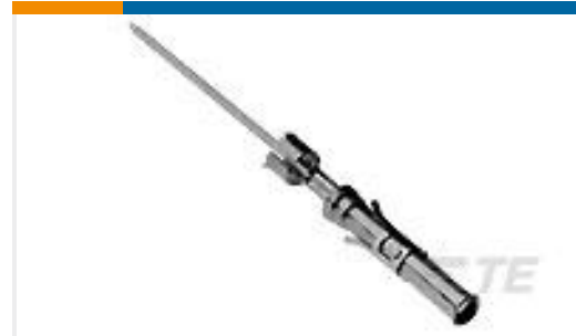
TE 产品编号5-66461-5 SKT, .062 DIA, .025 SQ POST, LP