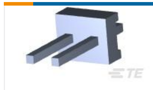
TE 产品编号640383-2 02P MTA156 HDR ASSY STR SQ SN