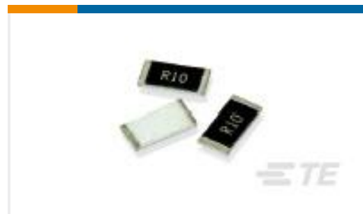
TE 产品编号3-2176057-8 RLP73K 3A R36 1% 1K RL