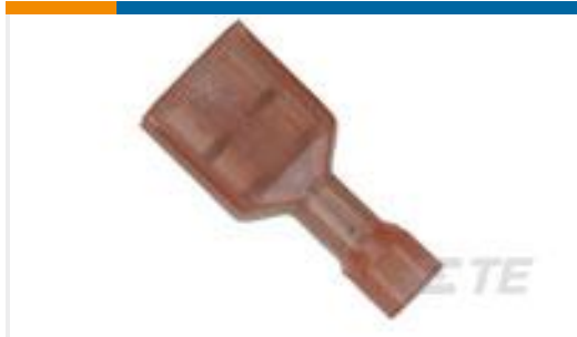
TE 产品编号2-520183-2 ULTRA-FAST 250 ASY REC 22-18 TPBR