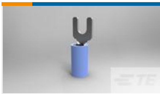
TE 产品编号8-35559-1 TERMINAL,PIDG SPD 16-14 6