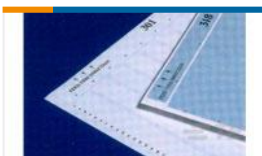
TE 产品编号414812-000 308-LE